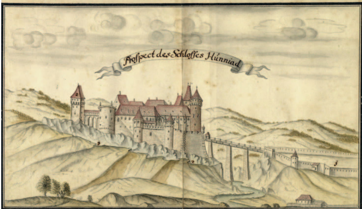
Nr: 3 Der Vorhoff 2. Der Thurn Neben genannt weiln der Johannes Hunniades darin gefangen gefessen als er von dem Banno Croatia aus der gefangenschaft befrejet worden. 3. Ein tieffer Graben in Felsen