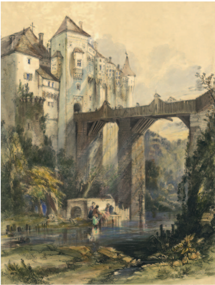
Vajdahunyad vára a tűzvész előtt (balra) és után ( jobbra)

kezések is teljesen leálltak. Szerepe akkor értékelődött fel ismét, amikor az 1470-es évek végén egyértelmű lett, hogy Mátyás fiúörökös nélkül marad, és a házasságon kívül született Corvin János került előtérbe. 1479-ben Mátyás – Magyarország történetében addig szokatlan módon – két örökös ispánságot adományozott fiának (Liptó és Hunyad), majd 1482-ben magát Vajdahunyad várát is neki juttatta. Ezzel Mátyás új birtokadományozási politika alapjait fektette le, amelynek célja Corvin János felemelése volt az ország legnagyobb mágnásai közé. A birtokok sorában Vajdahunyad kétségtelenül mélyebb üzenetet is hordozott: a Hunyadi család ősi fészkeinek átengedésével egyértelművé tette mindenki számára, hogy a király Corvin Jánost a család teljes jogú tagjának és örökösének tekinti.