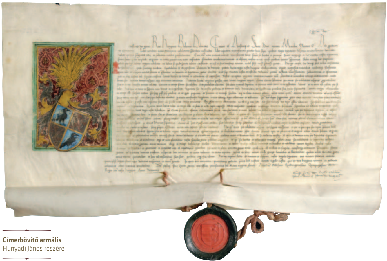
Címerbővítő armális Hunyadi János részére

matoztatta. Ezt követően kerültek a déli végekre, amikor Habsburg Albert király (1437–1439) a déli részek legfontosabb királyi várainak egy részét (Szörény, Görény, Orsova, Miháld) bízta a védelmükre, majd életének utolsó évében szörényi bánokká nevezte ki őket. Itt olyan hatalmasságok örökébe léptek, mint Ozorai Pipo és Tallóci Frank, akik tiszteletre méltóan védtek az ország határát.