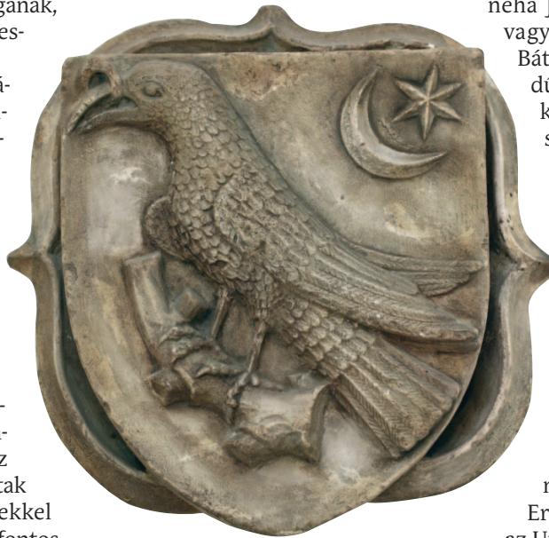
Hunyadi János címerének eredeti (fent) és bővített változata (lent)

Szórványos adatok arról tanúskodnak, hogy rokonságban állhatott II. Vladislav havasalföldi vajdával, akit rokonának (proximus noster) nevez, illetve a szintén havasalföldi származású Oláh Miklós apai nagyjával. Az előbbi esetben talán csak udvariassági formulával állunk szemben, a második esetben pedig Olahus genealógiai spekulációjával. A Kárpátokon kívüli régióban maradvra érdemes megemlíteni Jan Długosz azon tudósítását is, amely szerint Hunyadi János biztatására, az ő segítségével került trónra II. Péter vajda, aki feleségül vette egyik ötven év körüli nővérét. Ezt az adatot sem kétségbe vonni, sem más adatokkal alátámasztani nem lehet. Az kétségtelen, hogy II. Péter Hunyadi bizalmi embere volt, moldvai vajdaként neki adományozta Chilia várát. ✿