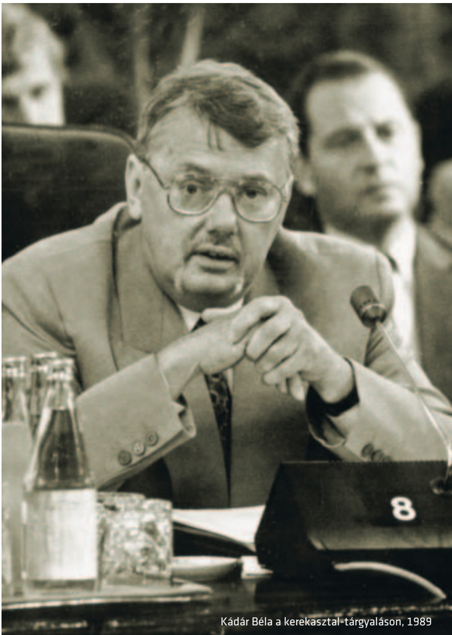
Kádár Béla a kerekasztal-tárgyaláson, 1989