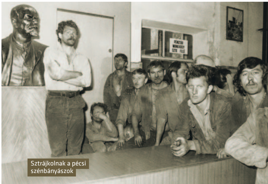
Sztrájkolnak a pécsi szénbányászok

nálás után a GDP már 1%-kal, az ipari termelés 3%-kal, a beruházások 4%-kal estek vissza.