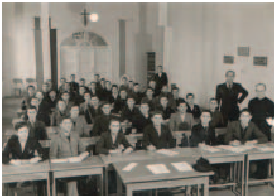
Kurzus az érdi népfőiskolán. A KALOT első tíz évében mintegy 32 ezer fiatal vidéki vett részt a szervezet tanfolyamain (fent)

1940. október 1-jén nyílt meg a KALOT első állandó jellegű bentlakásos népfőiskolája a fővárostól 15 km-re fekvő Érd községben. A jezsuita rendtől igen kedvezményes áron megvásárolt hajdani Szapáry-kastély ettől kezdve az iskolán kívüli katolikus felnőttoktatásnak adott otthont.