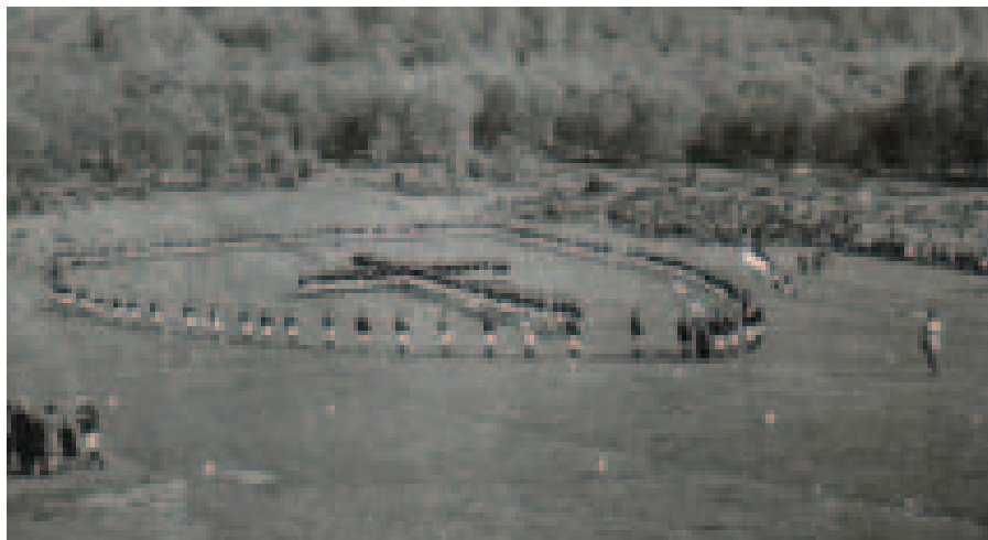
Minden nagyobb régió KALOT-ifjúsága évente egy alkalommal összegyűlt egy nagyobb seregszemlére is, Csíksomlyó, 1942

1938 szeptemberében Imrédy Kaposváron meghirdette az „új csodás for-