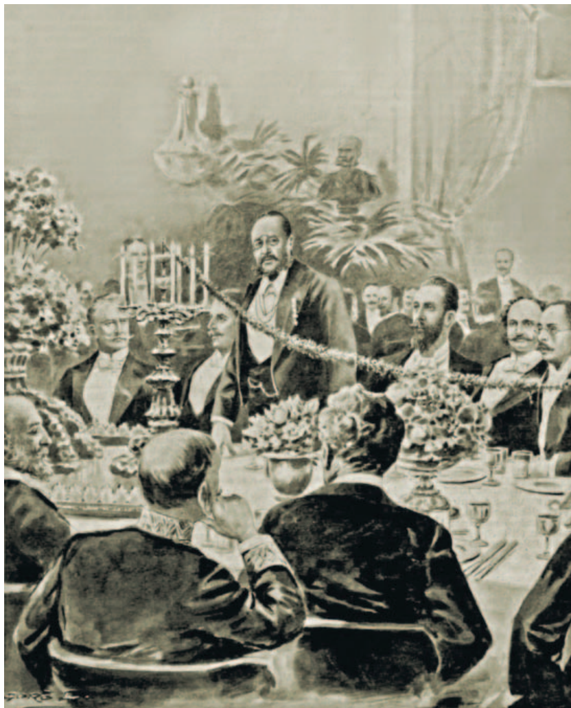
Széll Kálmán 1902-ben a Szent István-rend nagykeresztjét kapta a királytól. A miniszterelnök a magas kitüntetés alkalmából rendezett vacsorán beszél a Park Klubban

ismét átvenni, de így a legfontosabb végrehajtó szervezetek, mindenképp a közigazgatás felett személyes utasítási jogot szerzett.