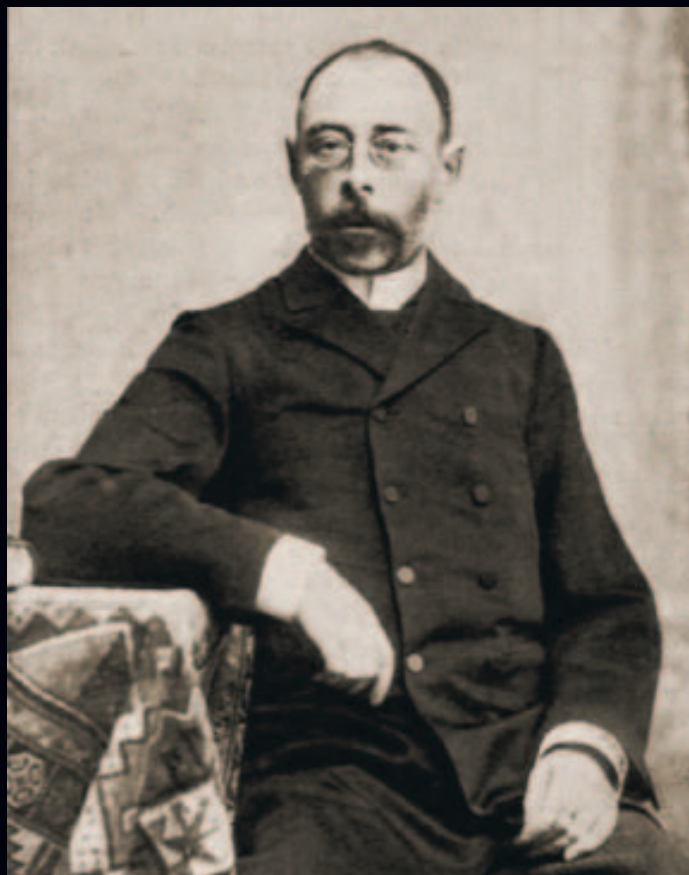
LUKÁCS LÁSZLÓ pénzügyminiszter:

1889. április 9.–1895. január 15. 1906. április 8.–1910. január 17. 1917. szeptember 16.–1918. február 11.