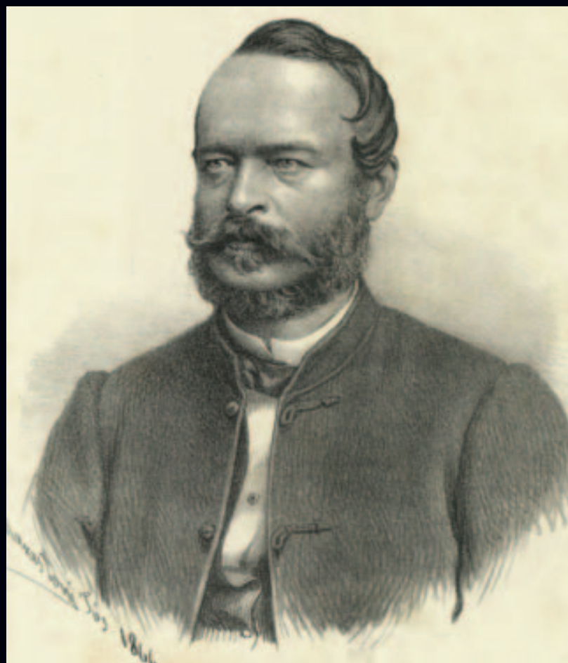
LÓNYAY MENYHÉRT a „vacsorapárt” feje

Három ponton szerettek volna Magyarország számára előnyösebb feltételeket kialkudni: kedvezőbb vámtételek,