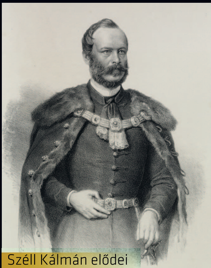
Széll Kálmán elődei

A Deák-párt és a Balközép Párt valamilyen formában történő egyesülésének gondolatát nem csupán a pénzügyi problémák hívták elő, hiszen már viszonylag korán, 1868–1869 fordulóján elindultak a kezdeti tapogatózások.