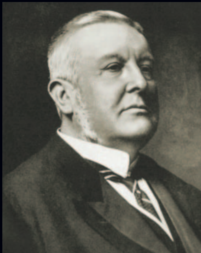
WEKERLE SÁNDOR pénzügyminiszter: