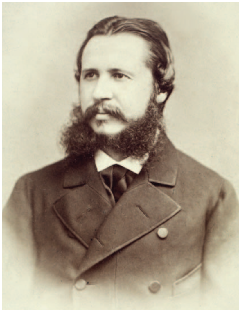
Széll Kálmán pénzügyminiszter korában. A kép a Vasárnapi Ujság 1900. december 9-i számában jelent meg

Amíg a jogi ügyekhez voltak kiváló embereink, addig a gazdasági, pénzügyi területen csak lassan nevelődött ki a