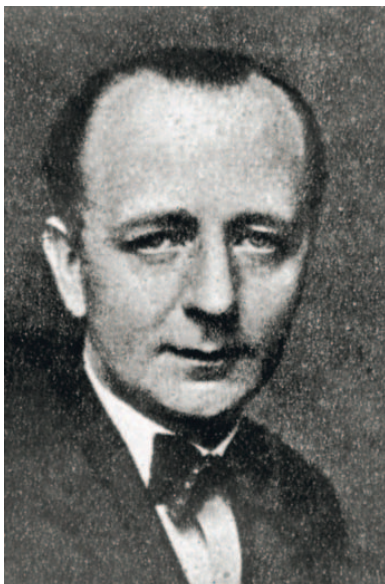
Baranyai Lipót (1894–1970)

res tárgyalásokra végül augusztustól került sor, miután Bakach-Besseneyt ki-nevezték a korábbi követ, Wettstein János helyére. Az angolszászok túl németbarátnak ítélték Wettsteint; ez azonban felületes minősítés volt, ugyanis Kállay iránt lojális – ha éppen a németektől való távolodást erős szkepticizmussal is szemlélő –, igen tapasztalt diplomatáról volt szó, akiben a kormányfő megbízott, bár politikai tárgyalások folytatására ő sem tartotta igazán megfelelőnek.