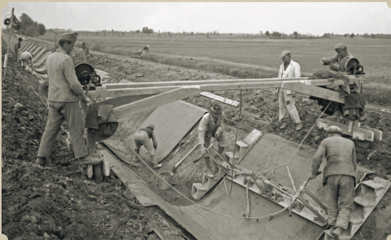
A tiszafüredi öntözőrendszer öntözőcsatornájának építése

A bizottság javaslata nyomán született meg az 1937. évi XX. törvénycikk az öntözőgazdálkodás előmozdításához szükséges intézkedésekről, amit az Öntözésügyi Hivatal megalakulása és Kállay Miklós elnöki kinevezése követett. Elnöki megbízatása idején (1937–1942) épült a békésszentandrás vízlépcső, valamint a tiszafüredi szivattyútelep és öntözőcsatorna. Elkezdtek tervezni a tiszalöki vízlépcsőt és a Keleti-főcsatornát is, melyek azonban csak 1945 után valósultak meg.