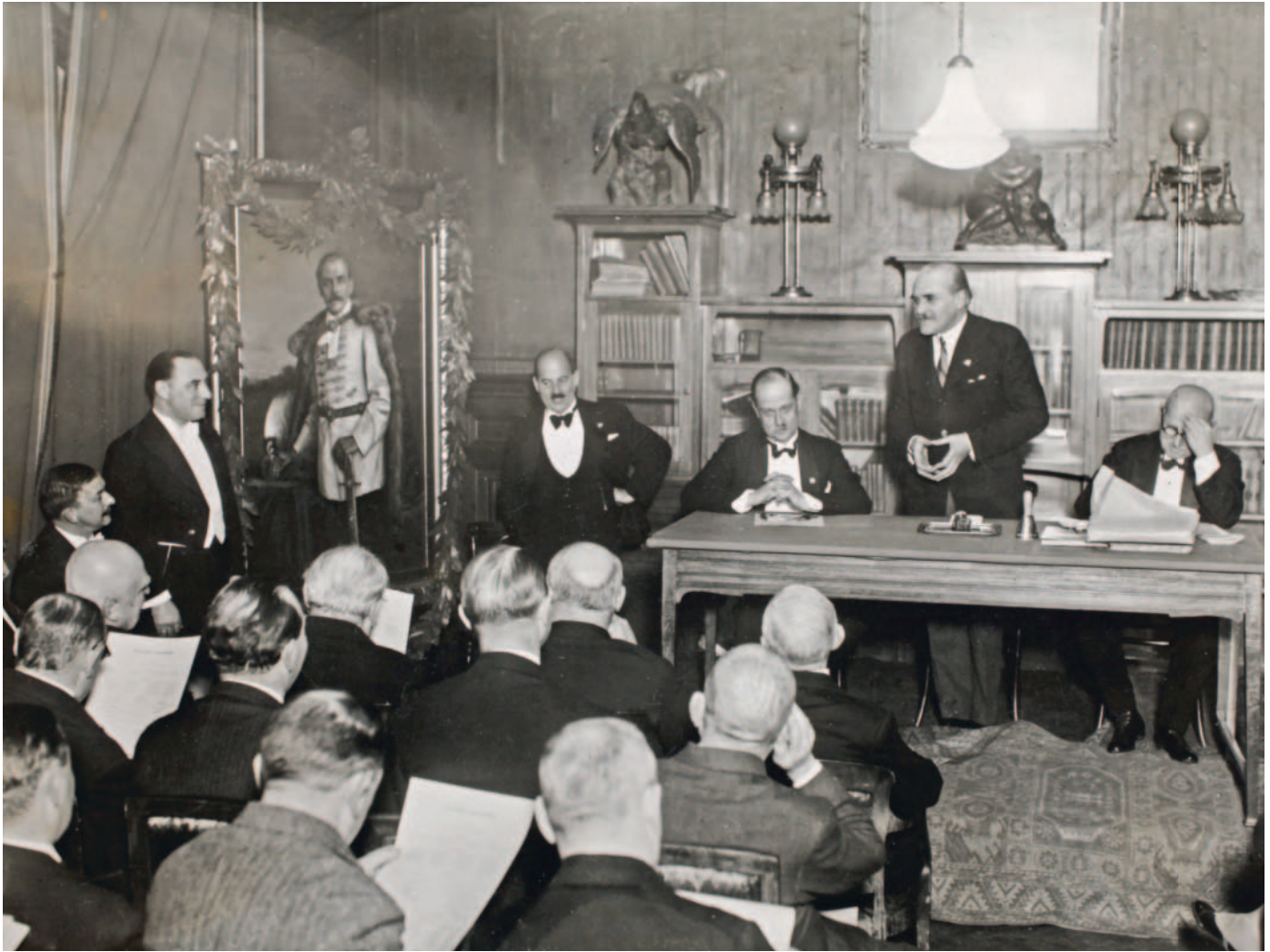
Kállay földművelésügyi miniszterként a Belvárosi Polgári Körben, 1933. december 14.

tók, ami súlyosan érintette a magyar kivitelt. Az ország hagyományos exportpiacainak (Németország, Ausztria, Olaszország) felvevőképessége végletesen beszűkült.