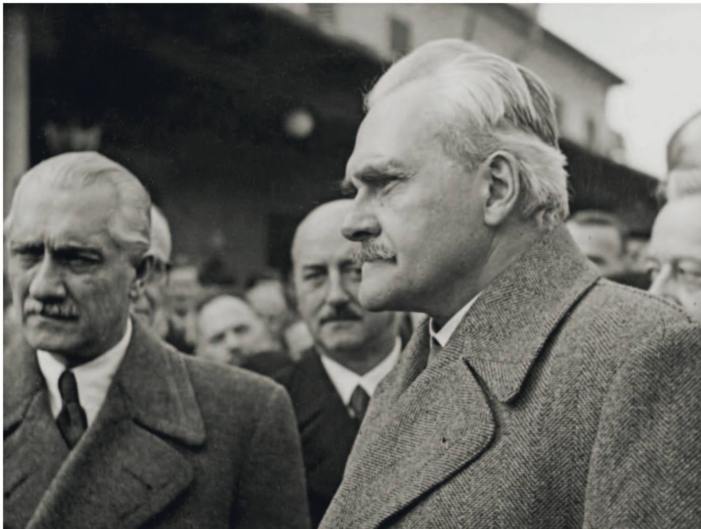
Kállay Miklós miniszterelnök az egri pályaudvaron, 1942

Kállay irányítása alatt az Öntözésügyi Hivatal dolgozta ki a Tiszalöki Vízlépcső és a csatlakozó Keleti-főcsatorna öntözőrendszerének terveit. A megvalósítást az 1937. évi XX. törvénycikk írta elő, amely a magyar mezőgazdasági export fejlesztését célozta. Szintén kiemelkedő eredmény volt a Békésszentandrásnál megépített duzzasztógát, amely lehetővé tette a nagyüzemi rizstermesztés megindítását. Az öntözésügy igen hatékonyan fellépő vezetőt nyert Kállay személyében, aki előtt az ajtók könnyen szélesre tárultak. Kállay leginkább ezen a területen, az Alföld és a mezőgazdaság ügyeivel foglalkozva érezte magát otthon, éppúgy, mint a birtokán virágzó almafák közt, büszkén mutogatva őket nála vendégeskedő politikustársainak: „Látod, ez az én munkám!”