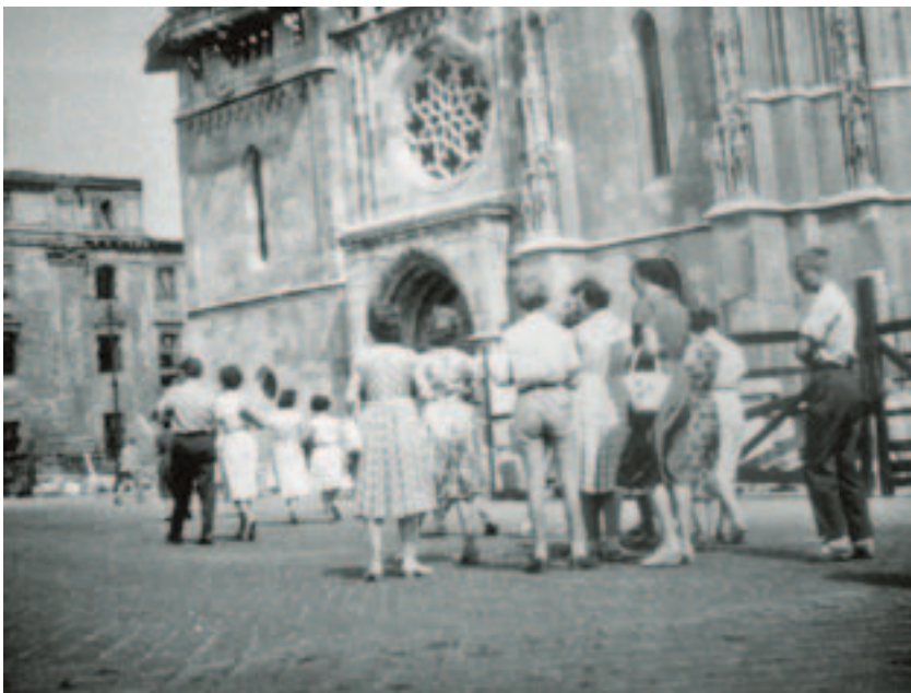
Megfigyelési fotó a Máttyás-templom előtt. A városnéző csoportot az egyik, a Központi Szemináriumból kizárt kispap kalauzolja. Az operatív tisztek turistának álcázva magukat készítették a felvételt.

hatolniuk, mit kell keresniük, hogyan kell a házkutatási jegyzőkönyvet felvenniük, és mi a teendőjük, miután visszaérkeztek a rendőrségre. A rendőröket felkészítették az őrizetbe vevők lehetséges magatartására, és ennek kapcsán egyénre szabott utasításokat is kaptak.