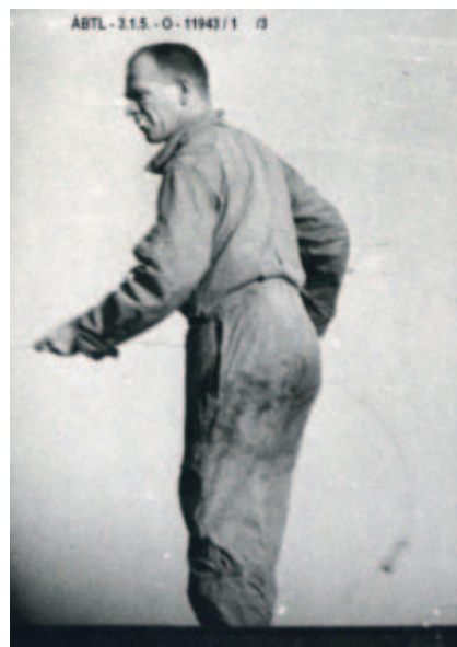
Peter Peterson amerikai elhárítótiszt a magyar állambiztonság lehallgatóberendezéseinek nyomait keresi az USA követségi épületének tetején

Mindszenty 1975. május 6-án halt meg, és kivánságára Mariazellben temették el. Temetéséről a politikai rendőrség hálózati személyekkel is készített jelentéseket, sőt fényképfelvételeket is, mégis mind a hírszerzés, mind a belső elhárítás szükségesnek tartotta, hogy egy-egy operatív tisztje jelen legyen a szertartáson. Az állambiztonság 1975. május 13–16. között,