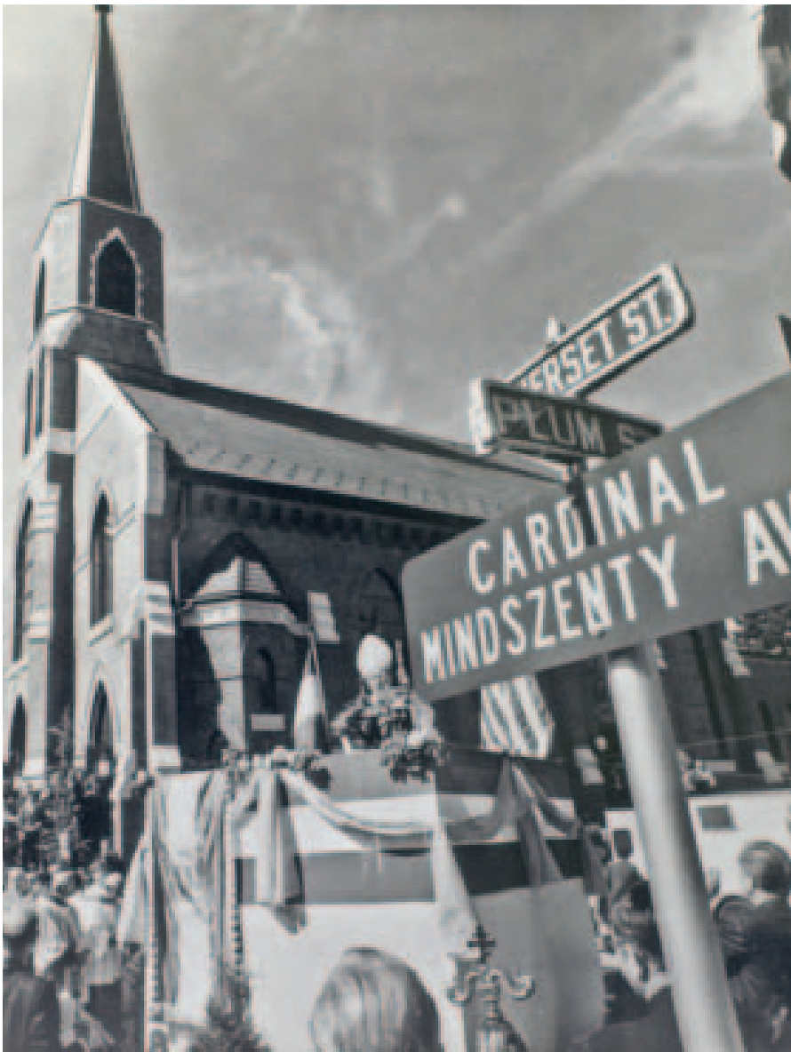
Mindszenty József felszenteli a New Brunswick-i Szent László-templomot, 1973

A keleti politika mérlegelésekor ma is az egyik legvitatottabb kérdés: könnyebbé vált-e a kelet-közép-európai országokban működő katolikus egyházak sorsa? Erre tagadhatatlanul volt remény, mert az „olvasás” korszaka, a II. vatikáni zsinat és a helsinki konferencia által teremtett légkörben bízni lehetett abban, hogy a kommunista államok tiszteletben tartják majd a vallásszabadságot. A Szentoszák keleti politikájának értékelése, újragondolása ma is javában tart, ahogy az akkori szereplők – Agostino Casaroli az élen – megítélése is viták kereszttüzében áll. Amikor 2008-ban Jorge Mario Bergoglio – akit a világ ma Ferenc pápáként ismer – Buenos Aires katedrálisában megemlékezett Casaroliról, „nagy bíborosnak” nevezte. Minősítése annak a békéltető szerepnek szól, amelyet a keleti politika művelése során Agos-