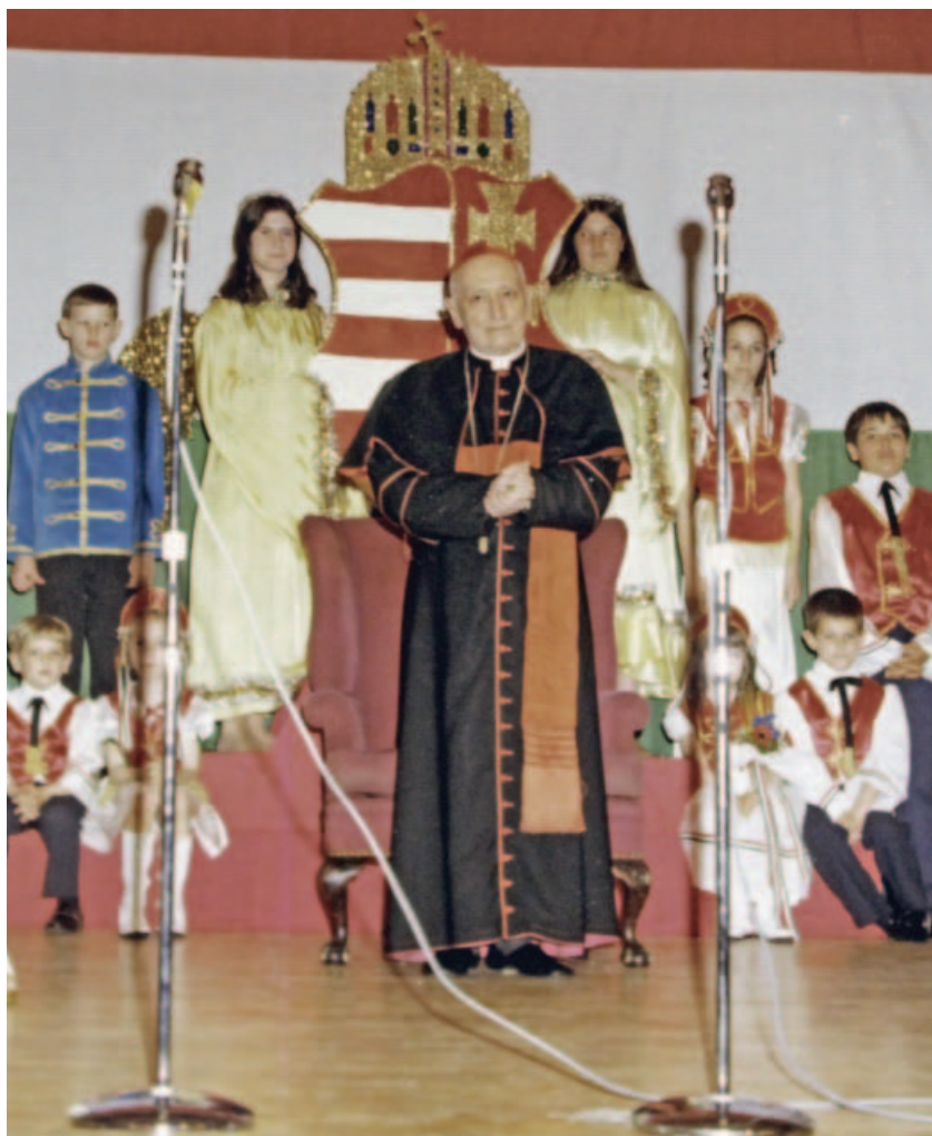
Mindszenty Amerikában, 1974. Az emigráns magyarság mindenütt nagy tisztelettel fogadta

tino Casaroli oly végtelen türelemmel ellátott.