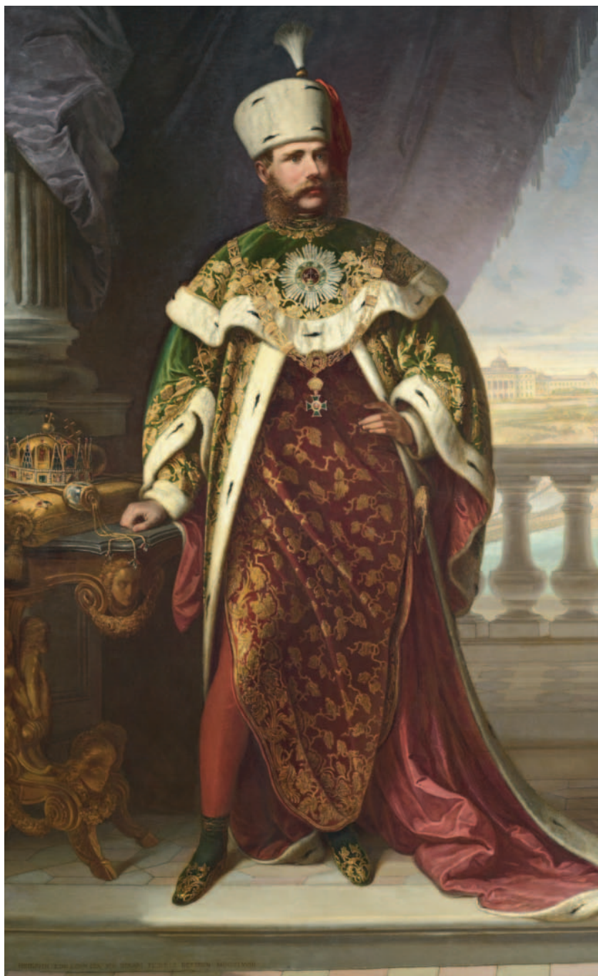
Ferenc József a Szent István-rend ornátusában

Az évi három-négyezer hivatalos irat döntő többségét ilyen, az uralkodó végső döntését igénylő felterjesztések tették ki. Például a századforduló környékén, 1899-ben 3953, 1900-ban 3443, 1901-ben 3396, 1902-ben 3418 felterjesztés érkezett az uralkodóhoz az osztrák és a magyar kormánytól, illetve a közös minisztériumoktól együttesen. Ezeket Ferenc József mindig alaposan átolvasta, esetleg széljegyzetek