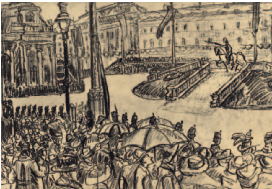
✿ Pór Bertalan rajza a Szent György téri kardvágásról az Érdekes Ujságban (fent)