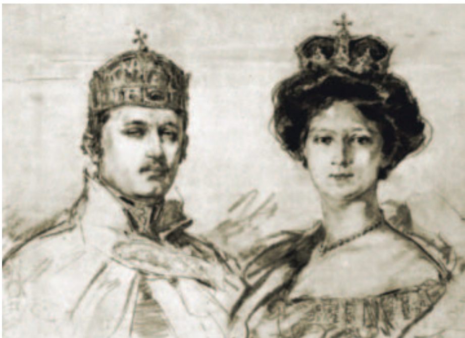
✿ Zádor István: Zita királyné koronázása (lent)