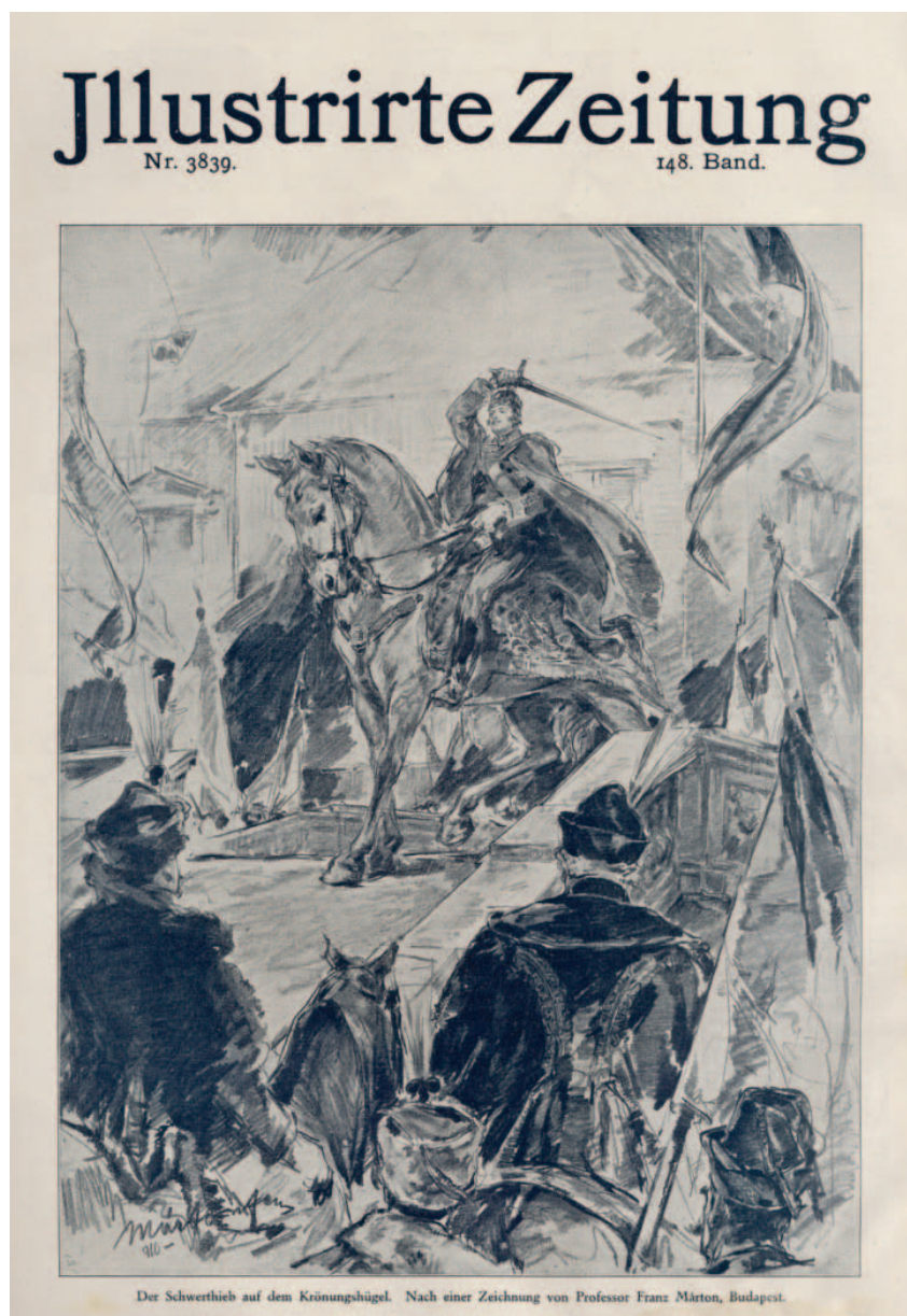
Der Schwerthieb auf dem Krönungshügel. Nach einer Zeichnung von Professor Franz Márton, Budapest.

Felix Schwormstädt vízfestménye a koronázásról az Illustrierte Zeitung ból (fent) Márton Ferenc: IV. Károly koronázási kardvágása az Illustrierte Zeitung címlapján (balra)