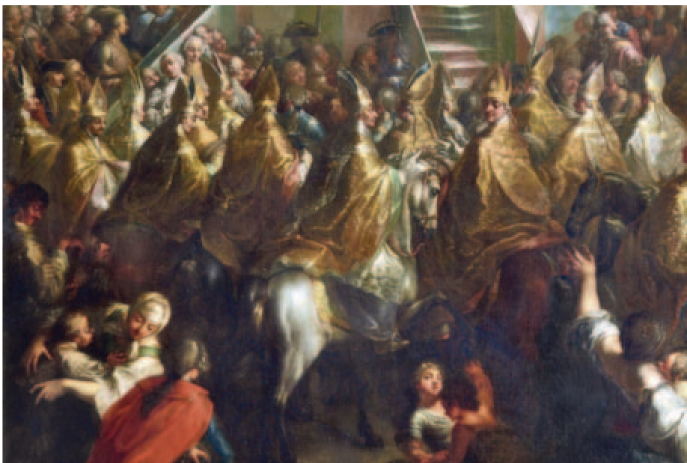
21. KÉP Püspökök lóháton (lent)