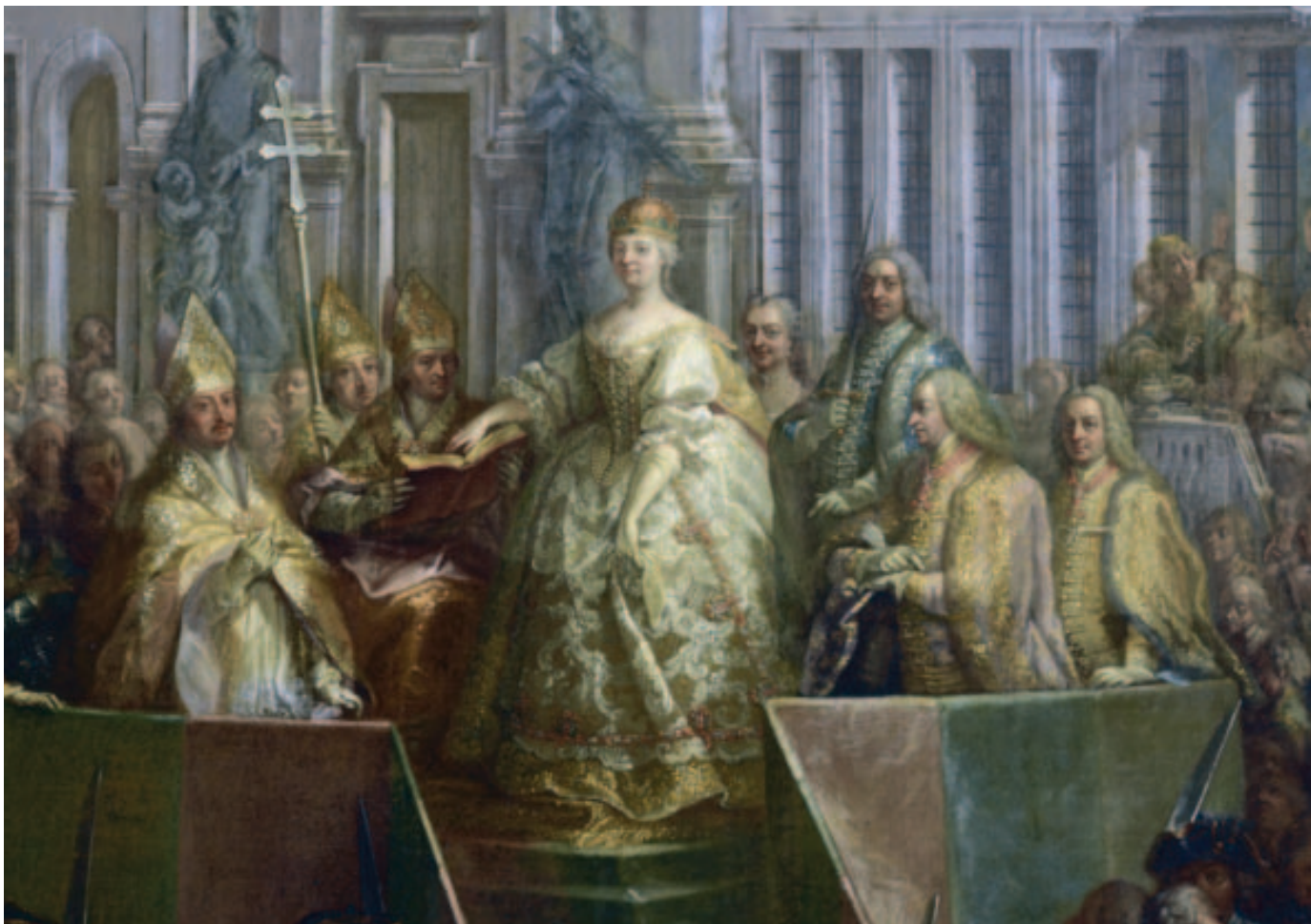
19. KÉP A királynő eskütétele az irgalmasok temploma előtti téren (bal oldalon)