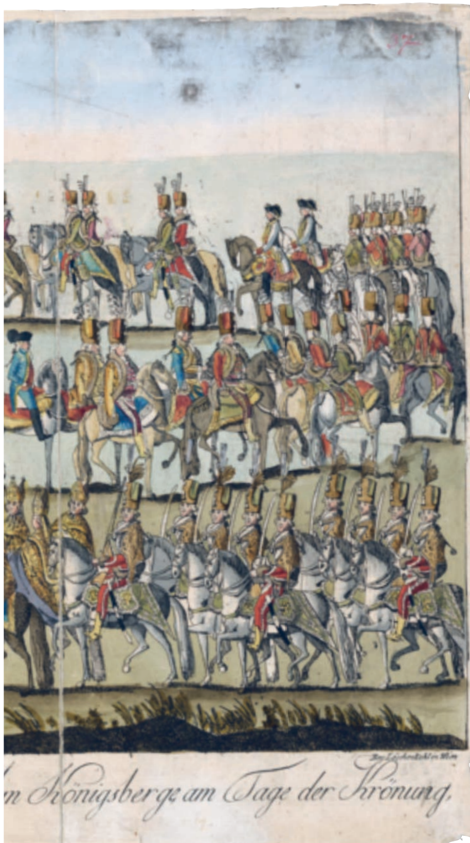
II. Lipót koronázási menete a Pozsonyi Városi Galéria metszetén, 1790. november 15-én