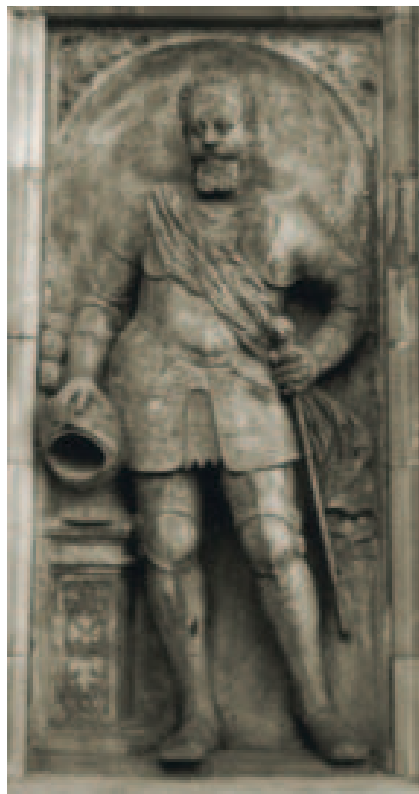
Pálffy Miklós komáromi, érsekújvári és esztergomi főkapitány és pozsonyi kapitány (1600†) síremlékének főalakja a pozsonyi dómban.

Az 1550-es évektől – a század néhány esztergomi érsekét (Oláh Miklóst,