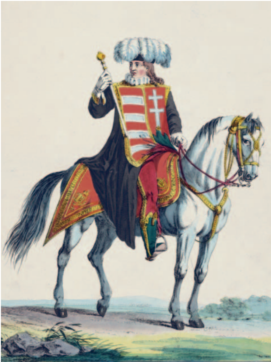
Magyar Koronázási | Der ungarische Wappen- és Czimeres Herold. | Herold.

Noha 1539-ig négy szertartást még Székesfehérvárott szerveztek meg, a koronázóváros 1543. szeptember eleji török megszállása jól jelezte a Közép-