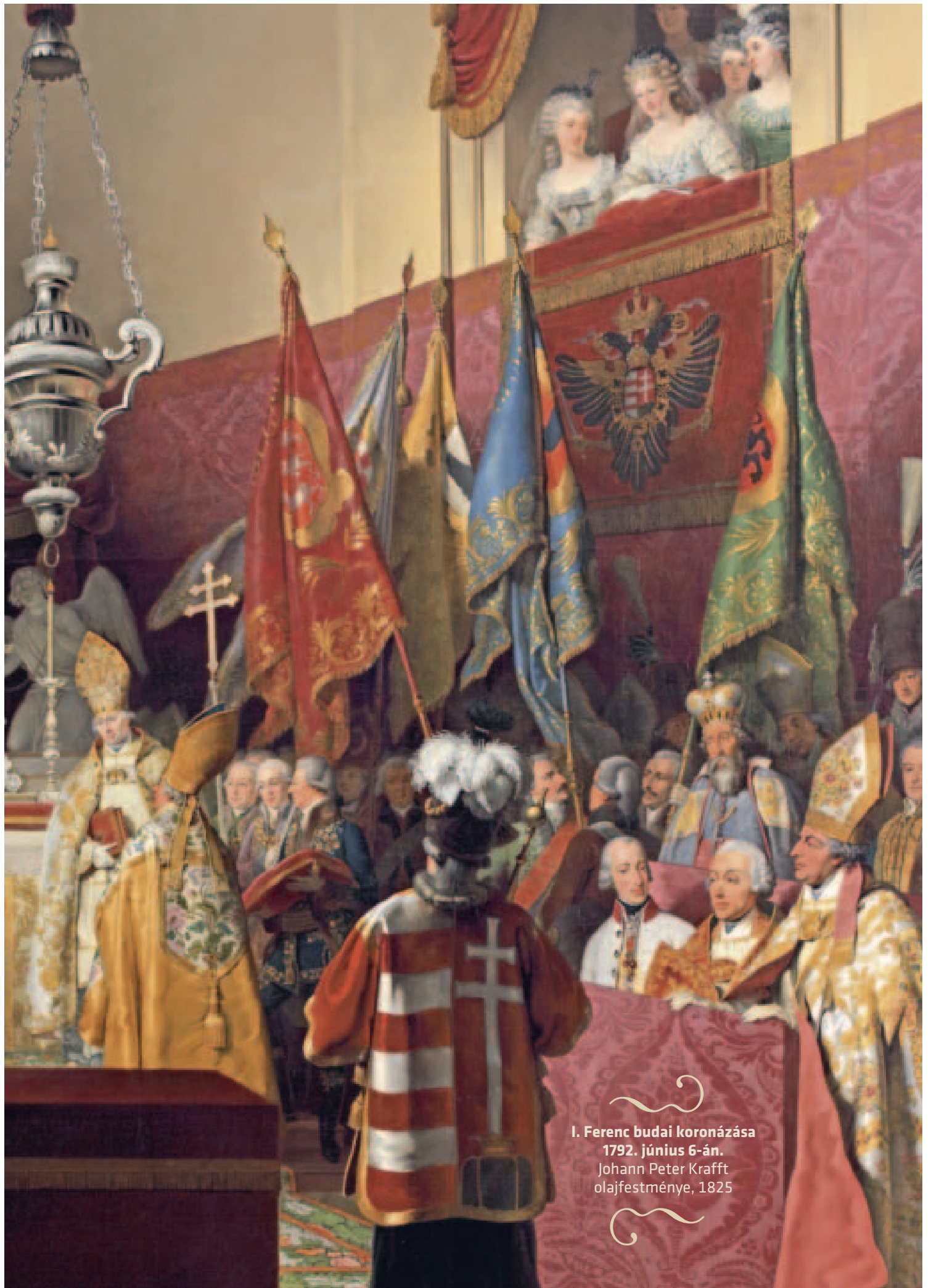
I. Ferenc budai koronázása 1792. június 6-án. Johann Peter Krafft olajfestménye, 1825