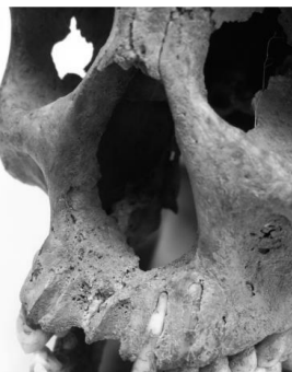
5. ábra: Rhinomaxillaris szindróma (facies leprosa), Orosháza–Bónum, Faluhely (2013) – 16. sír. Fig. 5: Rhinomaxillary syndrome (facies leprosa), Orosháza–Bónum, Faluhely (2013) – Grave 16.

A patológiás csontelváltozások közül az egyik legsúlyosabb a 2013. évi ásatás során feltárt 16. sírban fekvő, Adultus elhalálzási életkorcsoportba tartozó nő arckoponyáján megfigyelhető facies leprosa (5. ábra; Balázs és mtsai 2015, 2019). A Mycobacterium leprae -re jellemző specifikus aDNS-szakaszok kimutatása is sikeres volt (Balázs és mtsai 2019).