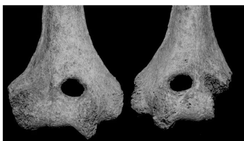
3. ábra: Foramen supratrochleare, Orosháza–Bónum, Faluhely (2013) – 83. sír.

Fig. 2: Examples for the diverse anthropological composition of Orosháza–Bónum, Faluhely cemetery (numbers indicate the grave numbers): Grave 26 (2012) Europo-Mongolid, Grave 5 (2013) Cromagnoid, Grave 35 (2013) Mongolid, Grave 71 (2013) Europid, Grave 92 (2013) gracile Mediterranean, Grave 119 (2013) gracile Europid