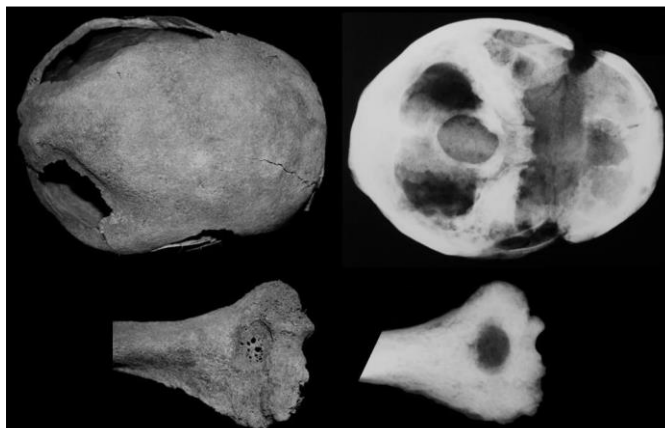
1. ábra: Biparietalis senilis osteoporosis a cranium-on és csonttritkulás nyoma a jobb humerus-on, Orosháza–Bónum, Faluhely (2013) – 75. sír.

Orosháza–Bónum, Faluhely temető eddig feltárt 180 bioantropológiai leletének elhalálási életkorcsoport szerinti megoszlása: Inf. I.: 16%, Inf. II.: 10%, Juv.: 13%, Ad.: 10%. Mat.: 32%, Sen.: 8% (vizsgálatra alkalmatlan: 11%). A 101 felnőtt szexus szerinti megoszlása: nő – 46%, férfi – 52% (vizsgálatra alkalmatlan – 2%). A Senium elhalálási életkorcsoportba tartozók csontmaradványain több esetben megfigyelhetők a magas életkor okozta csonttritkulásra jellemző fiziológias felritkulások (1. ábra; Balázs 2017).