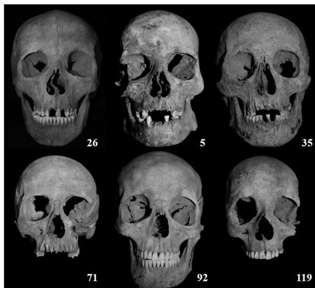
2. ábra: Példák Orosháza–Bónum, Faluhely (temető) változatos embertani összetételére (a számok a sírszámokat jelzik): 26. sír (2012) europo-mongolid, 5. sír (2013) cromagnoid, 35. sír (2013) mongolid, 71. sír (2013) europid, 92. sír (2013) gracilis mediterrán, 119. sír (2013) gracilis europid.

Fig. 2: Examples for the diverse anthropological composition of Orosháza–Bónum, Faluhely cemetery (numbers indicate the grave numbers): Grave 26 (2012) Europo-Mongolid, Grave 5 (2013) Cromagnoid, Grave 35 (2013) Mongolid, Grave 71 (2013) Europid, Grave 92 (2013) gracile Mediterranean, Grave 119 (2013) gracile Europid