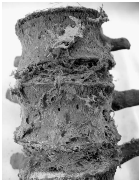
2. ábra: A szabadon álló csigolyákon kismértékű hypervascularisatio nyomai (29. számú múmia). Fig. 2: Traces of slight hypervascularisation on the vertebrae (No 29).