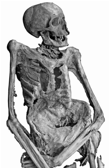
4. ábra: Nigrovits Antal (54. számú múmia) kachektikus teste. Fig. 4: Cachectic body of Antal Nigrovits (No 54).

gerincen kisebb mértékű, a háti gerincen nagymértékű (60 foknál nagyobb) scoliosis figyelhető meg. A nyaki és a háti szakaszon kyphosis is észlelhető (7. ábra). A súlyos deformációt fejlődési rendellenesség okozta és nem csonttuberkulózis.