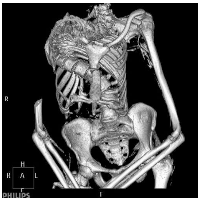
7. ábra: A nyaki és háti régió virtuális 3D-s rekonstrukciója (54. számú múmia). Fig. 7: Virtual 3D model of the neck and back region using the CT scan data (No 54).

A korábban elvégzett paleomikrobiológiai kutatások eredménye szerint a tüdőszövetből és a has bal oldalából vett minták egyaránt negatív eredményt mutattak. Ugyanakkor a has egy másik részéből származó minta a nested PCR-ral (92 bp) erős pozitív, a single stage PCR-ral (123 bp) negatív eredményt adott. Az újvizsgált tüdőszövetekből kinyert DNS-extraktum valamennyi frakciója a real-time PCR alkalmazásával az IS1081 lókusza specifikus primerekkel negatív eredményt adott.