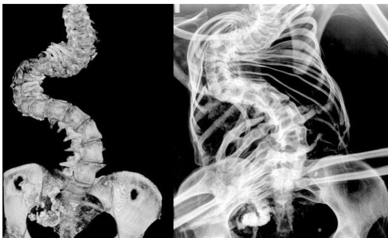
8. ábra: A röntgenfelvétel és a virtuális 3D-s rekonstrukció jól mutatja a nagymértékben deformálódott testet (97. számú múmia, Tauber Antónia).

Fig. 8: X-Ray picture and virtual 3D model of the extremely deformed body (Antonia Tauber, No 97).