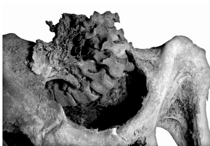
5. ábra: Deformálódott nyaki régió, közelebbi kép (54. számú múmia). Fig. 5: Deformed neck, a closer look (No 54).