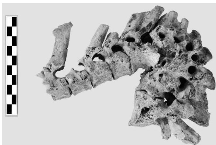
2. ábra: Súlyos, krónikus spondylitis tuberculosa (Pott-gibbus) eset az Alsónyék-Bátaszék lengyeli kultúra 4027-es sírjából.

A 4027-es sírből származó 30–40 év közötti férfi különös jelentőséggel bír: a gerincen megfigyelhető jellegzetes krónikus spondylitis tuberculosa (Pott-féle púp) mellett a koponyán endocranialis elváltozások és cribra orbitalia, míg a bordákon és a hosszúcsontokon periostitis jeleit észleltük. Ebben az esetben mind a hosszúcsontokból, mind a fogakból vett minták esetén pozitív eredményt kaptunk az IS6110 repetitív elem tekintetében, ezzel egyértelműen alátámasztva a Mycobacterium tuberculosis aDNS jelenlétét az egyén maradványaiban.