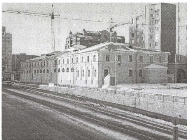
1. kép: A Krasznójarszki Kerület Állami Levéltára, korábban a krasznójarszki vásárcsarnok (épült 1857–65 között). Emeletén volt 1904–29. között a Jenyiszejvidéki Területi Múzeum.