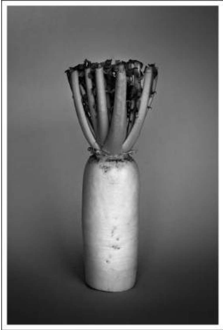
Trifusz Péter: Kikészítve, 2013