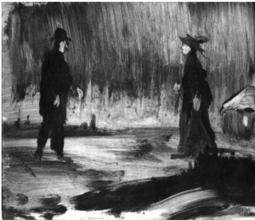
Akik csak ritkán titokban láthatják egymást