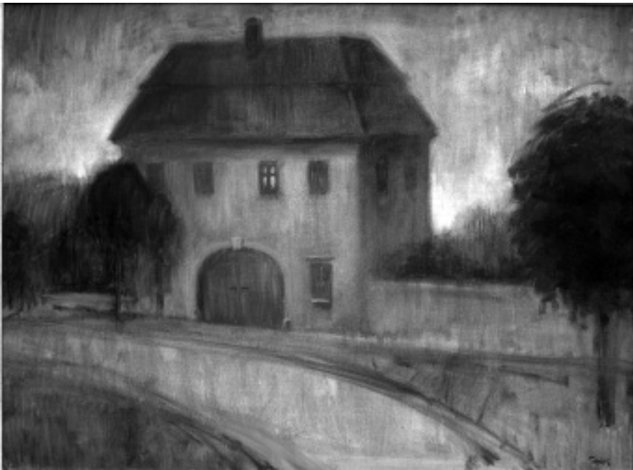
Ki van a kastélyban

nincs szoba és utca, se nappal és éjszaka, se bárányok, poros lapu, fekete vérű bodza, vacsorák melege, aztán megint a harangok zúgnak, jön vissza és perzsel a jégfelhő, jön északról és délről, foszlik kőrózsa, lombosfű, kutya, szédülsz, ha csak gondolsz egy tavaszt-kiáltó hazára, hej, te, testvér! minden fegyverünk halott, mint a bot, lábunk alatt látatlan lélegzik egy darabka dűlő, jár rajtunk a varjú-idő, mintha itt mindig gyász lenne: tele az álmunk, a föld és a nők haja versekkel, tele az elalvó ház emberekkel s vakoskodó fácánokkal.