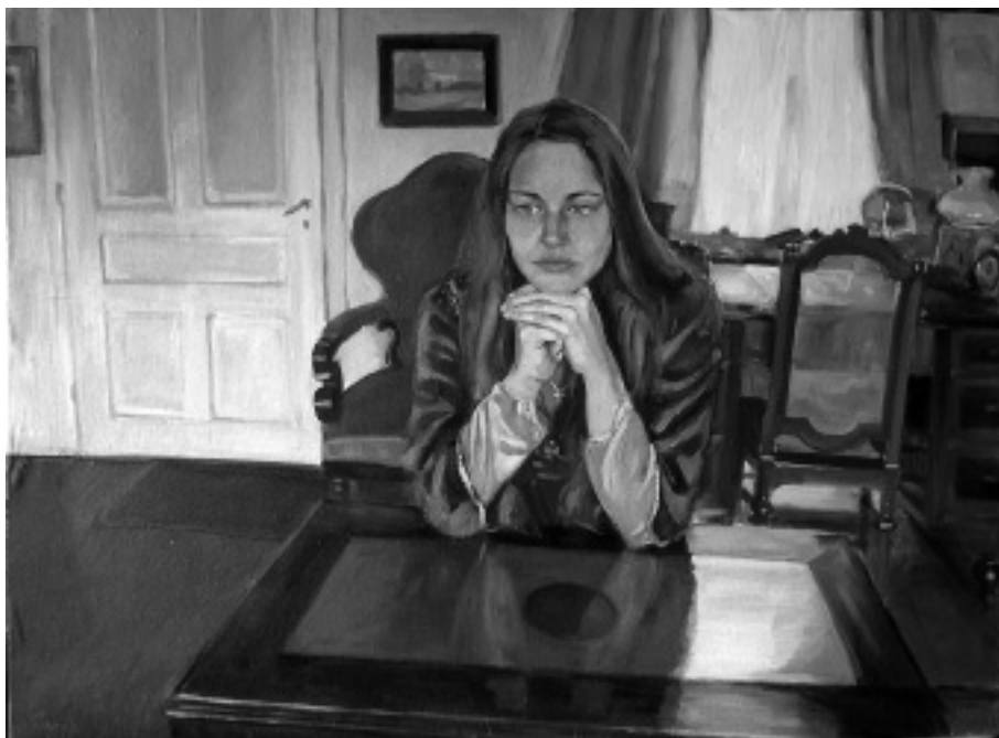
Magamra zárom az ajtót (hommage a Fernand Khnopff)

De Tibi nem aludt. Szapora léptekkel közeledett, aztán benyitott az ajtón, és hangszálait szintén nem kímélve rám kiáltott: