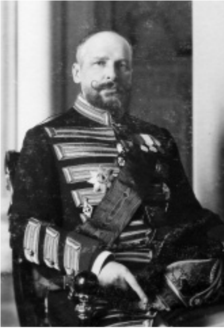
Pjotr Sztolipin 1908-ban