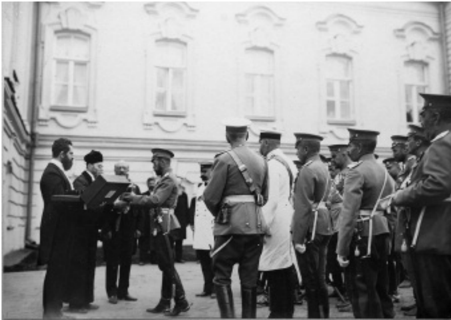
II. Miklós fogadja a zsidó delegációt. Kijev, 1911. augusztus 30. (Sztolipin háttal, fehér egyenruhában)