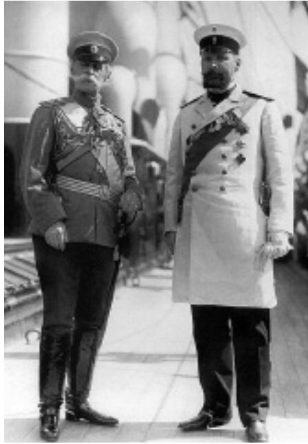
Sztolipin és Frederiksz gróf udvari miniszter