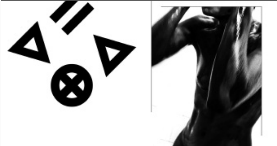
Részlet, a Fényelemek című fotókiállítás anyagából (2003)