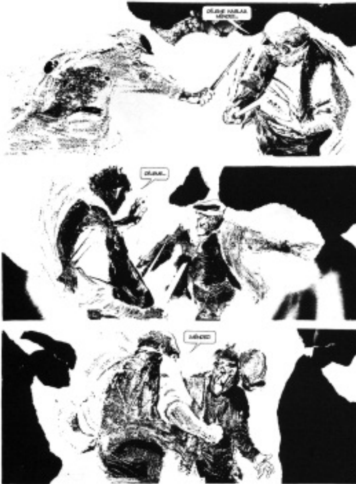
Carlos Trillo korai realista noirja: Un Tal Daneri

Becsukta szemét, és megszűnt körötte a világ.