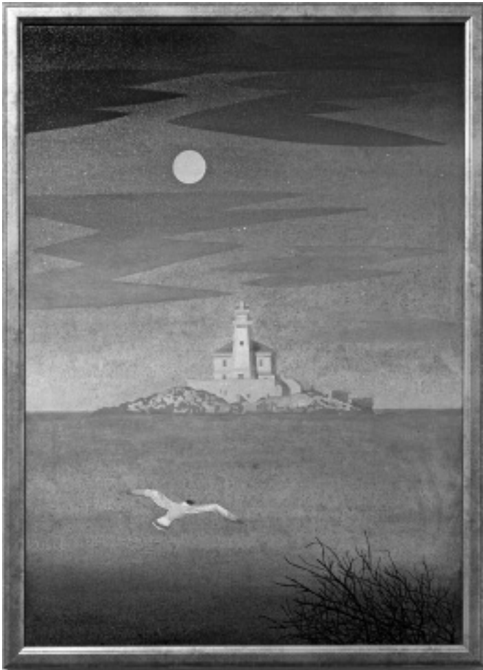
Világító torony madárral

Jönnek szememből a versek, mint éjszaka a csillagjelek, küldenem kell egy képeslapot, mielőtt még visszamegyek.