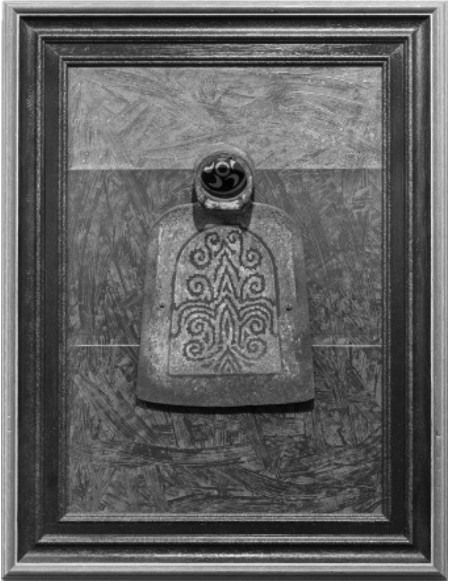
La Belle Jardiniere