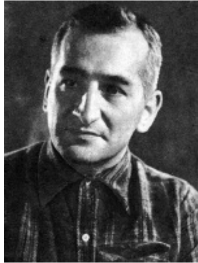
Héctor Germán Oesterheld (1919–1977?). Az író, miután családjával együtt csatlakozott egy szélsőbaloldali gerillacsoporthoz a Videla-rezsim idején, rejtélyes körülmények között eltűnt