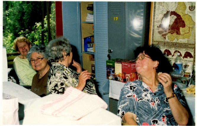
A „pletyka pogácsa” megtette a hatást, na meg egy két dugó is „kiugrott” az üvegekből....

Viszontlátásra 2011-ben.....pár kép a „break-up”-ról