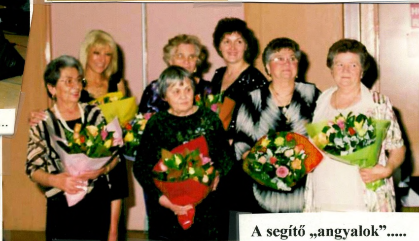
A segítő „angyalok” ....