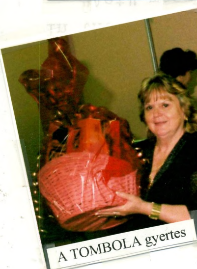
A TOMBOLA gyertes