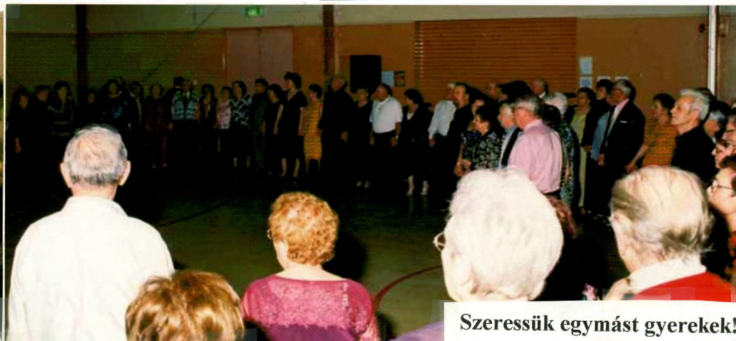
Szeressük egymást gyerekek!