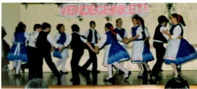
az idősebb táncosok...