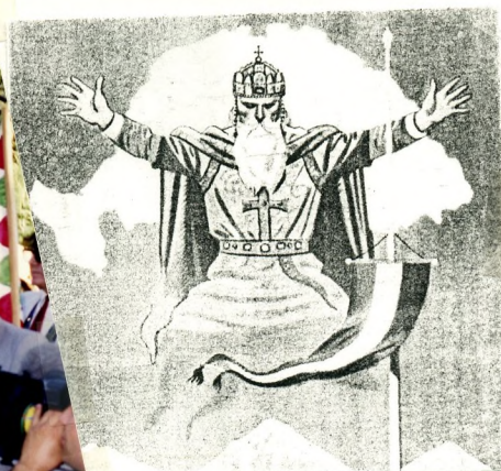
Orbán Viktor leleplezi a Trianon emlékére állított