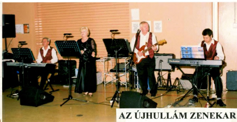
AZ ÚJHULLÁM ZENEKAR