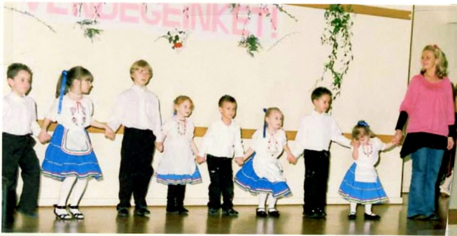
ezek voltak a kicsik.....