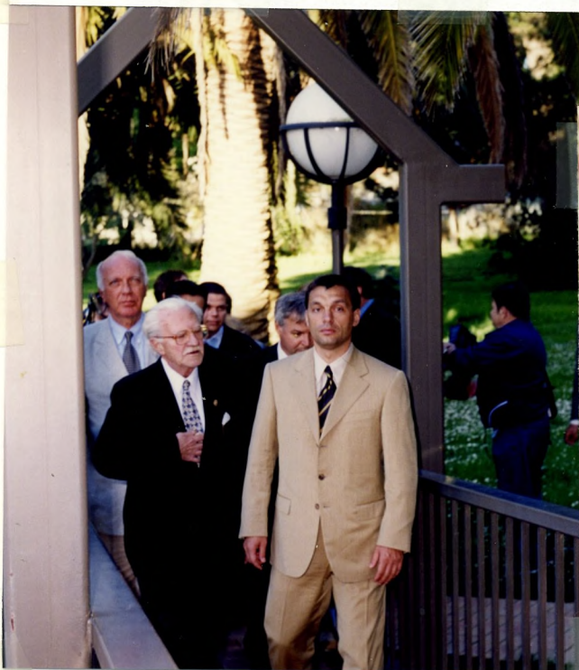
Faith Ferenc a Központ titkára fogadja és Kíséri, az ismertető körútján Orbán Viktort.