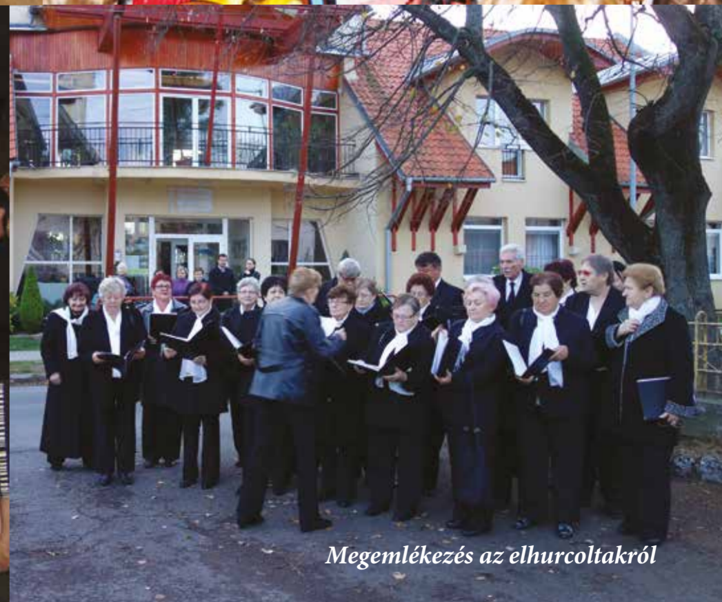
Megemlékezés az elhurcoltakról