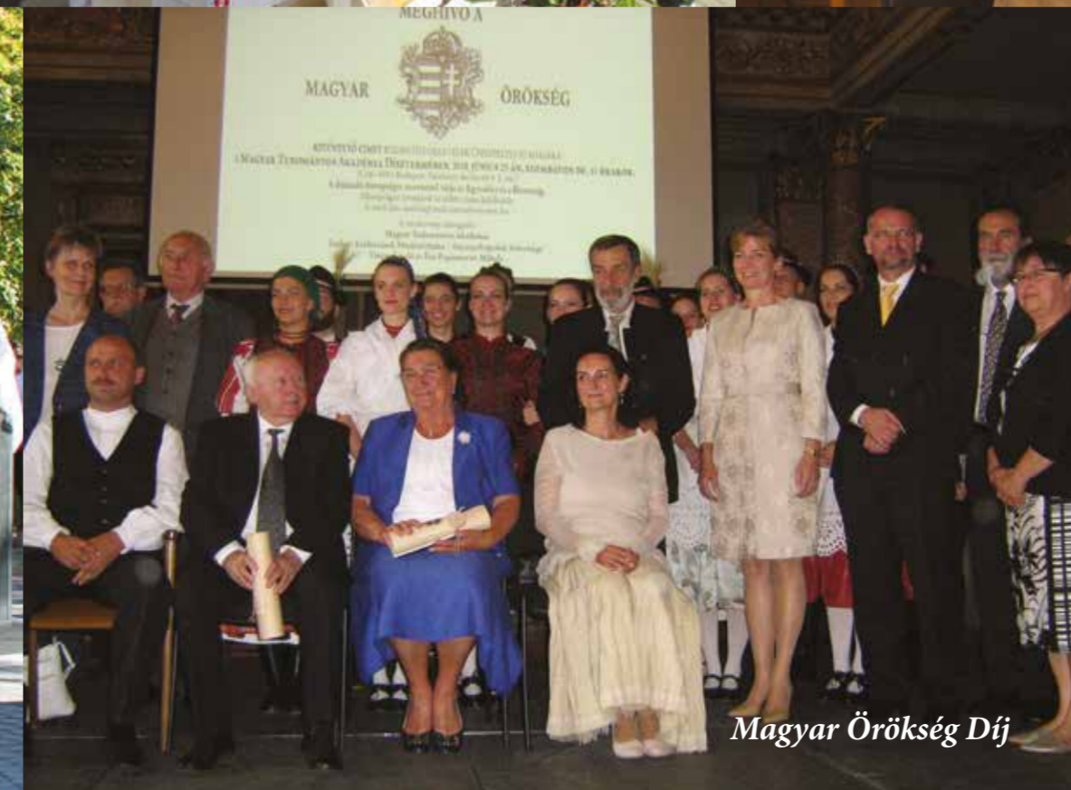
Magyar Örökség Díj