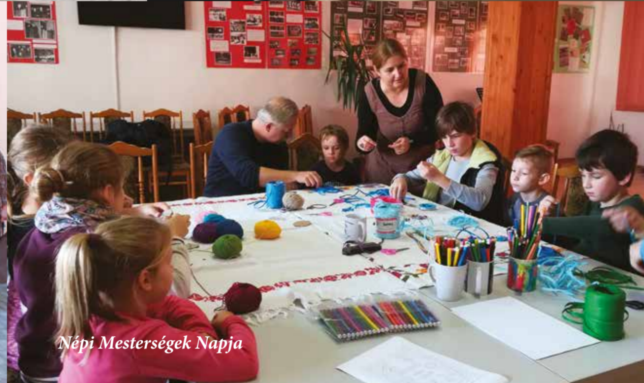
Népi Mesterségek Napja