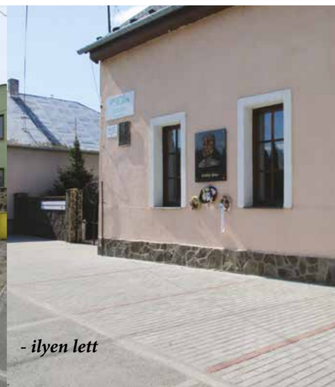
- ilyen lett