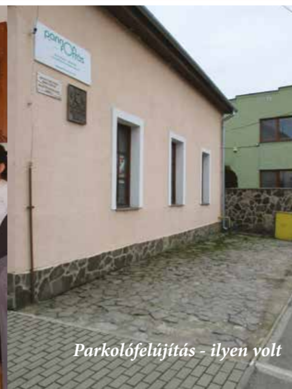
Parkolófelújítás - ilyen volt