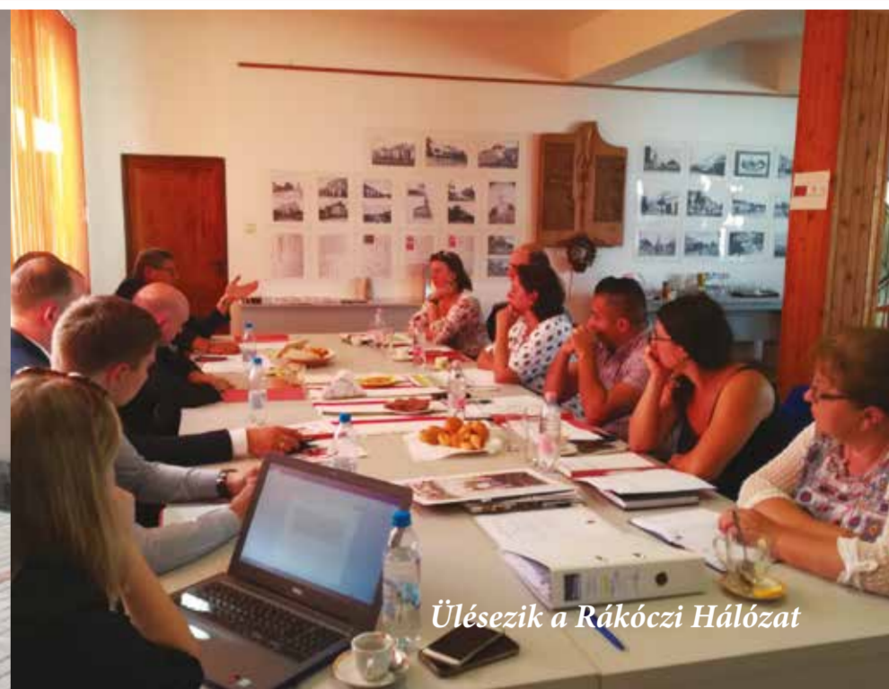
Ülésezik a Rákóczi Hálózat