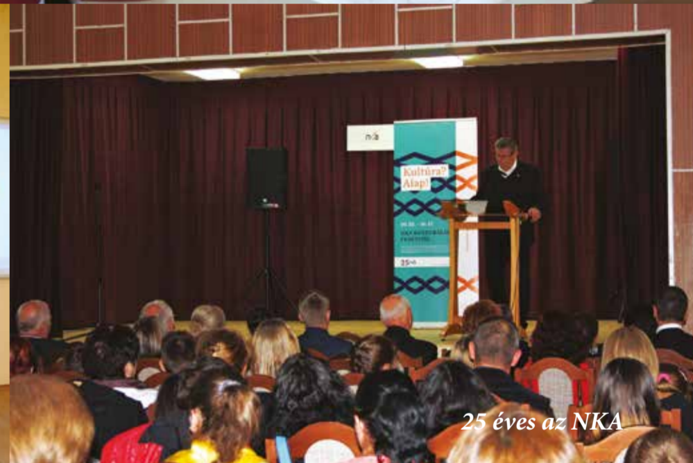
25 éves az NKA