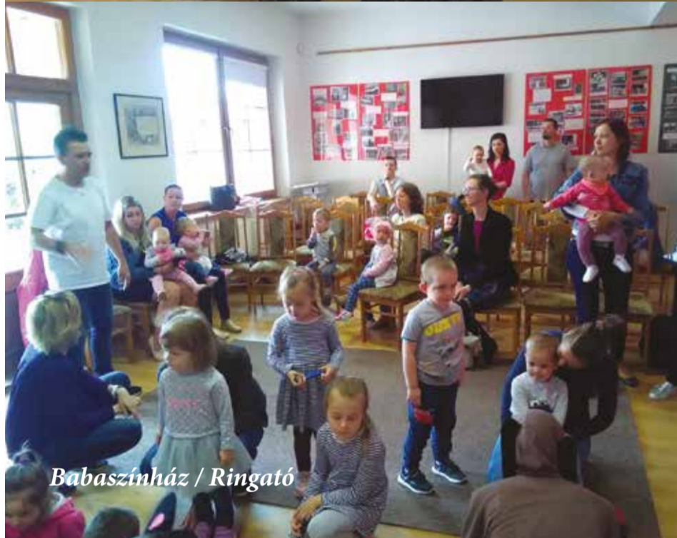
Babaszínház / Ringató