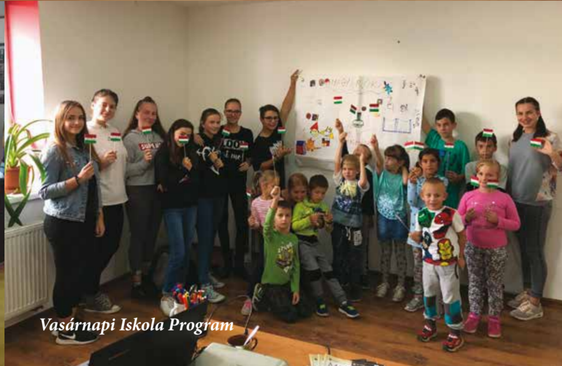
Vasárnapi Iskola Program