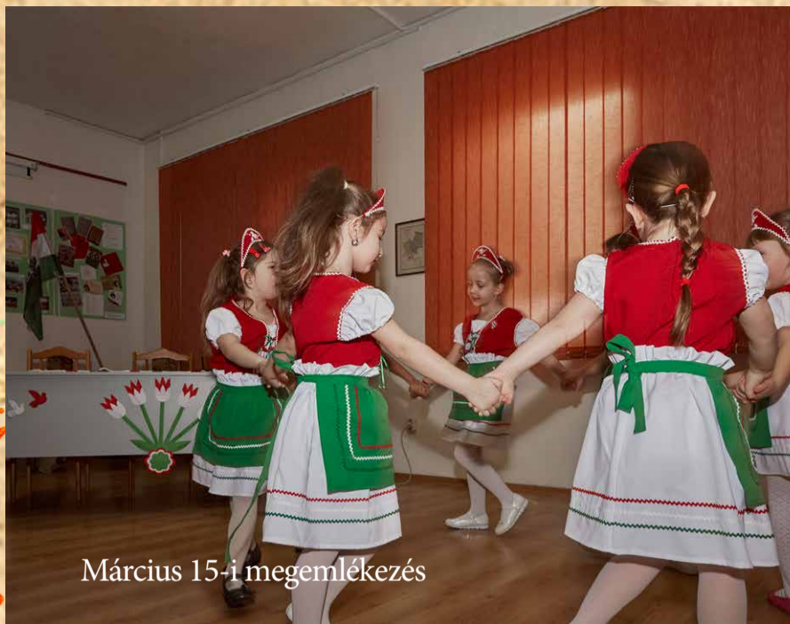
Március 15-i megemlékezés