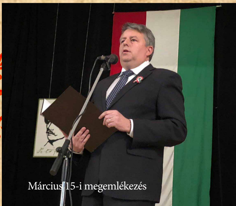
Március 15-i megemlékezés