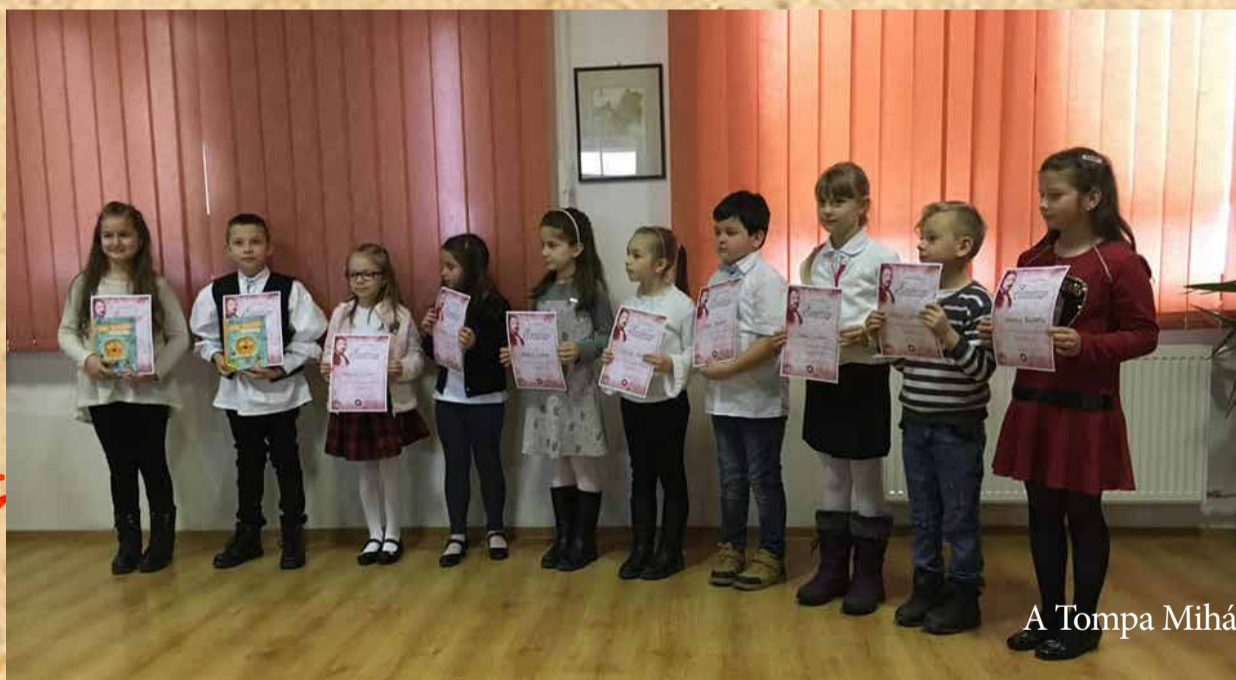
A Tompa Mihály járási szavalóverseny