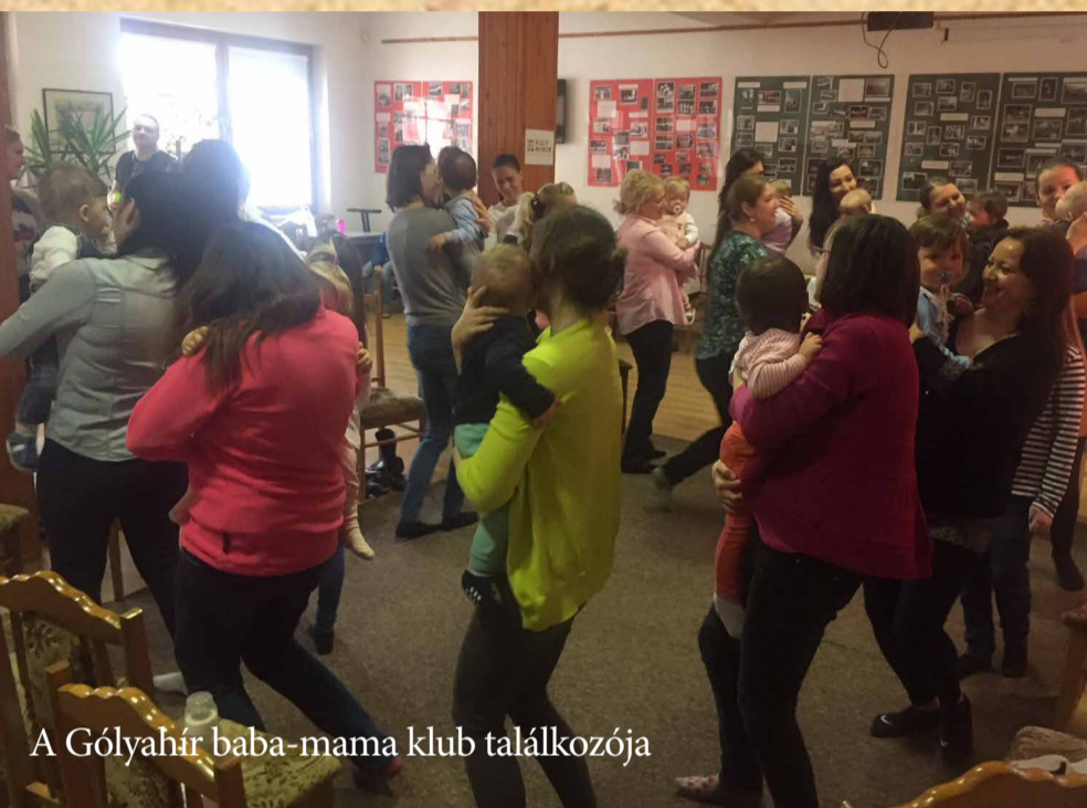
A Gólyahír baba-mama klub találkozója