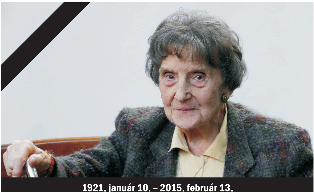
1921. január 10. – 2015. február 13.

Kiválasztottak koszorújában lesz virág a most vég-ső hazába tért lélek is. Ismertük itteni életében, ismertük erős buzgalmát, fáradtságot nem ismerő elszántságát mindazért ami folklór, és tárgyi emlékekbe rejte golgotai ormon, szikla-sírban nyert szent pecsétet, mikor „tavasz virrada, piros hajnal hasada”. Szent szókat gyűjtögetett hosszú évekig. Sosem várt jutalmat. Értetlen halandóktól mit várt volna – más nyelveket beszélőktől, akik sokan voltak, ha előállt teli kosarával. A kevesek erejével győzte: rendíthetetlenül védte az idősök ajkáról hangba-szóba testesült kincseket.