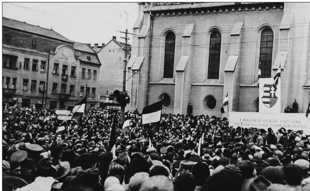
A Kossuth téri nagygyűlés résztvevői – háttérben a volt Korona Szálló és a Nagyboldogasszony templom (okt. 31.)