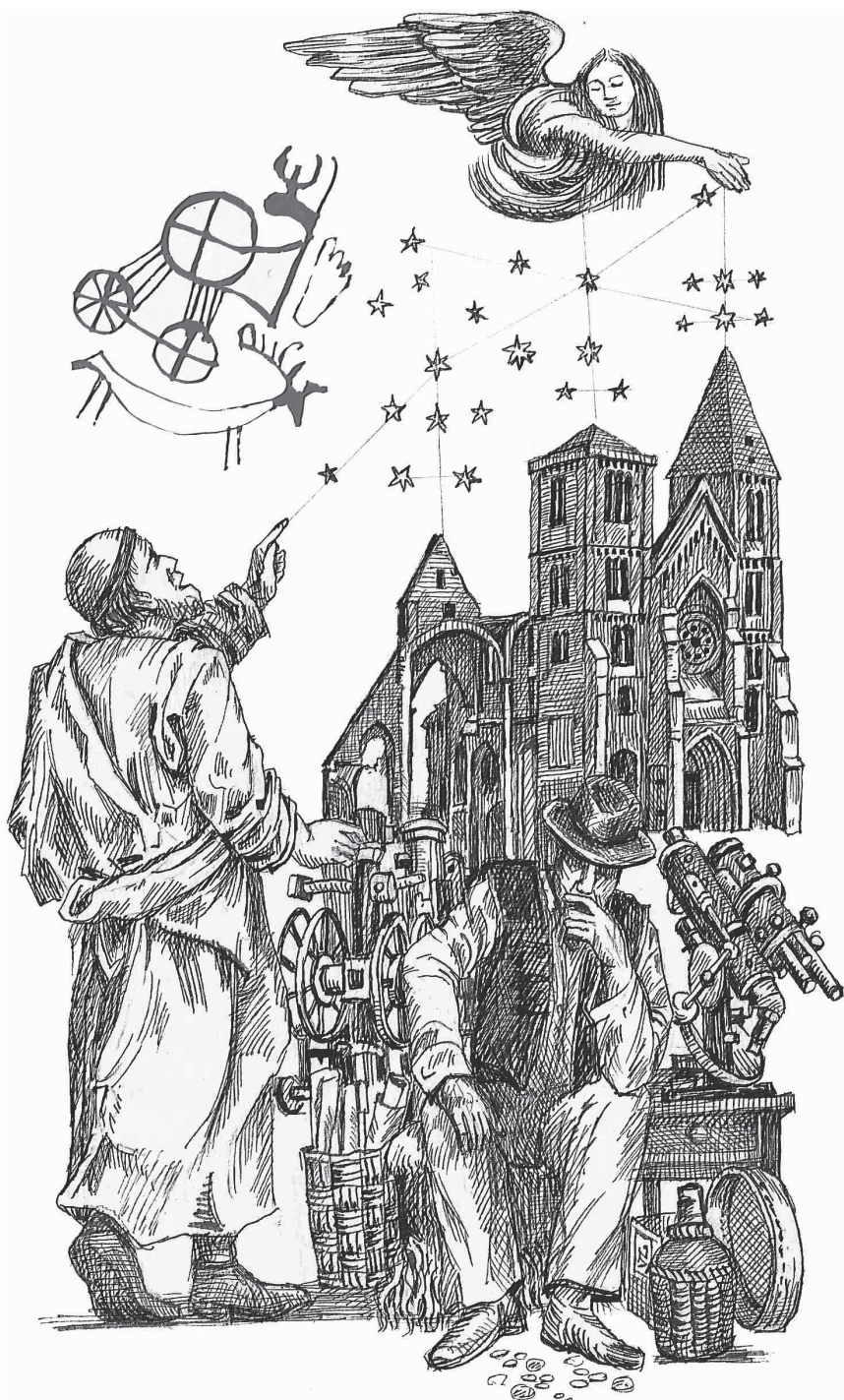
Vén Zoltán versillusztációja