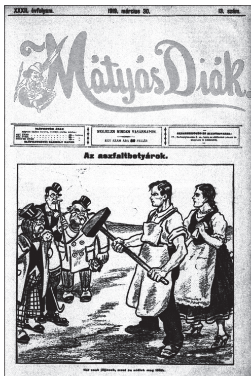
A Mátyás Diák 1919. március 30-i számának címlapja

A diktatúra külügyi népbiztosa, Kun Béla azonban már március végén tett közzé olyan nyilatkozatot, amely alkalmas lehetett az efféle reménykedések szertefosztatására. A Neue Freie Presse című osztrák újság munkatársának adott interjújában, amelynek magyar nyelvű változata az egyesült párt egyik napilapja, a Vörös