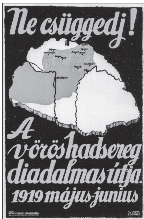
A Közoktatásügyi Népbiztosság Hadsereg-propaganda Ügyosztályának plakátja

Ám nem csupán szöveg, hanem képes ábrázolás is jelezte a propagandában azt, hogy a Tanácsköztársaság irányítói a történelmi Magyarország kereteiben gondolkodnak: a Közoktatásügyi Népbiztosság Hadsereg-propaganda Ügyosztályának – Szabó Viktor szerint valószínűsíthetően a felvidéki visszavonulás után készült