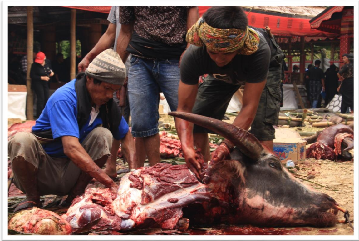
10. kép: A böllérek a szertartás után azonnal elkezdi feldolgozni az állatokat

A holttestet a szertartássorozat 11. napjáig nem temetik el, ezután ismételt rítusok közepette helyezik végső nyughelyére, de nem a földbe, hanem sziklába vájt barlangokba vagy a sziklából kiálló gerendákra, függősírokra fektetik. A legtöbb síron faszobrokat helyeznek el, melyek az elhunytat formázzák, ezek neve: tautau . A sajnálatos - leginkább turista - lopásoknak köszönhetően azonban egyre kevesebb család teszi ki a tautau -t a sírhoz, sokkal inkább otthon őrzik őket biztonságban. Európai szemmel talán szokatlannak tűnhet, hogy a temetők az aktív közösségi élet színterei és középpontjai.