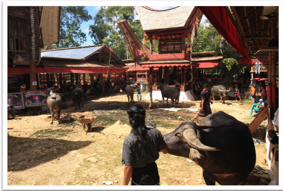
4. kép: A vizibölnyek bemutatása, háttérben a legmagasabb tongkonán, ami az elhunyt balzsamozott testét rejt

Érkezésünkkor rögtön feltűnt, hogy a közhangulat egyáltalán nem a gyász és a szomorúság jellemzi, sokkal inkább az öröm, a jókedv; szinte fesztiválhangulatot tapasztaltunk. A többnapos szertartássorozat az ajándékok bemutatásával és felmérésével kezdődik, az állatokra felfestik az adományozó család nevét. Ez a cselekmény sokszor napokig is elhúzódhat: meséltek olyan temetésről is, amire több mint 10.000 ember látogatott el, így rendkívül hosszú ideig tartott a befogadó, vendégeket köszöntő rítusok sorozata.