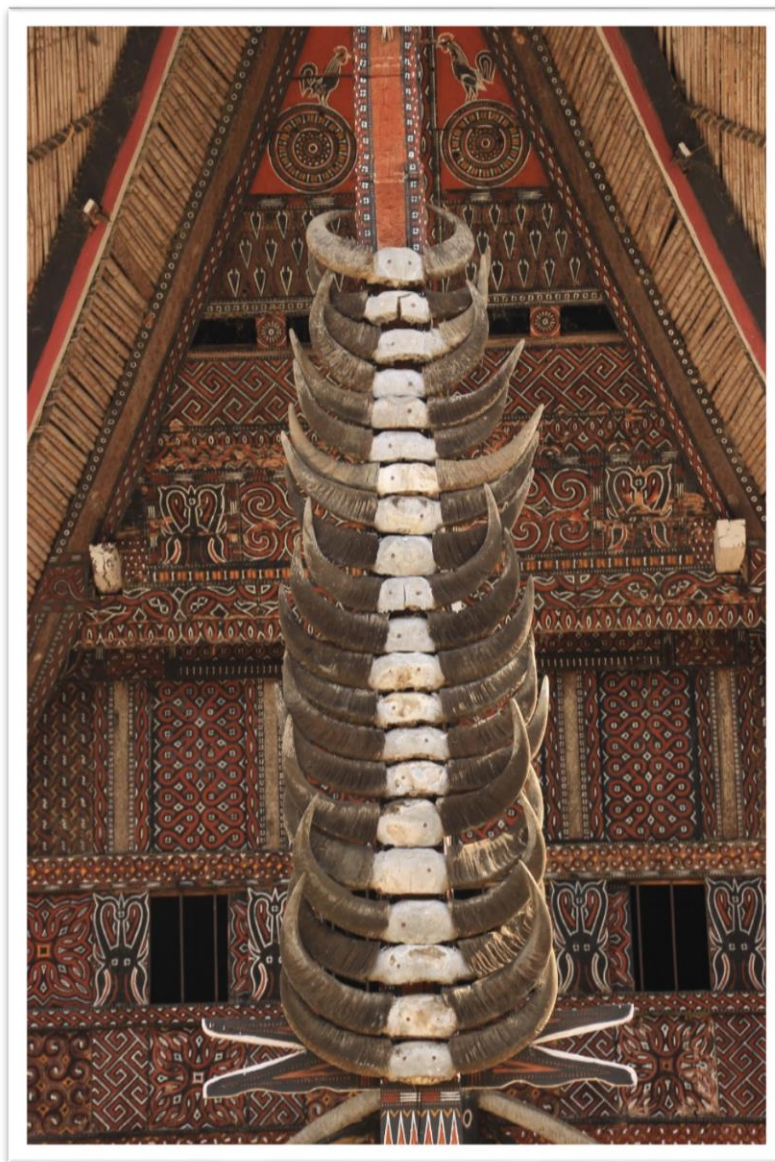
9. kép: A temetésen feláldozott bölények szarvai a tongkonánok tróféáivá válnak

A vizibölényekkel és a disznókkal történő különleges bánásmód az állatok megbecsülése is kijelöli az állat fontos státuszát a közösségen belül. A vendégfogadási napokon a disznókat ugyanúgy felsorakoztatják és bemutatják: pontosan nem számoltuk össze, de körülbelül 100 disznót mutattak be. Az állatok négy lábát összekötözve, egy bambuszrúdra rögzítették őket, így a rudak emelésével 4-5 ember könnyen mozgathatott egy-egy malacot. Míg a bivalyok feláldozása ünnepélyes keretek között történik, addig a disznókat sokkal inkább, ha nem is rejtve, de a háttérben dolgozzák fel. Úgy vélem, itt a gazdasági funkció kerül előtérbe. A nap folyamán 10-15 ember szinte folyamatosan, a helyszín egy kissé háttérbe szorult területén böki a disznókat, majd megperzseli és feldolgozza. A legtöbb fogást, amit a szertartás napjaiban felszolgálnak, ezen disznók húsából készítik el a számtalan vendégnek.