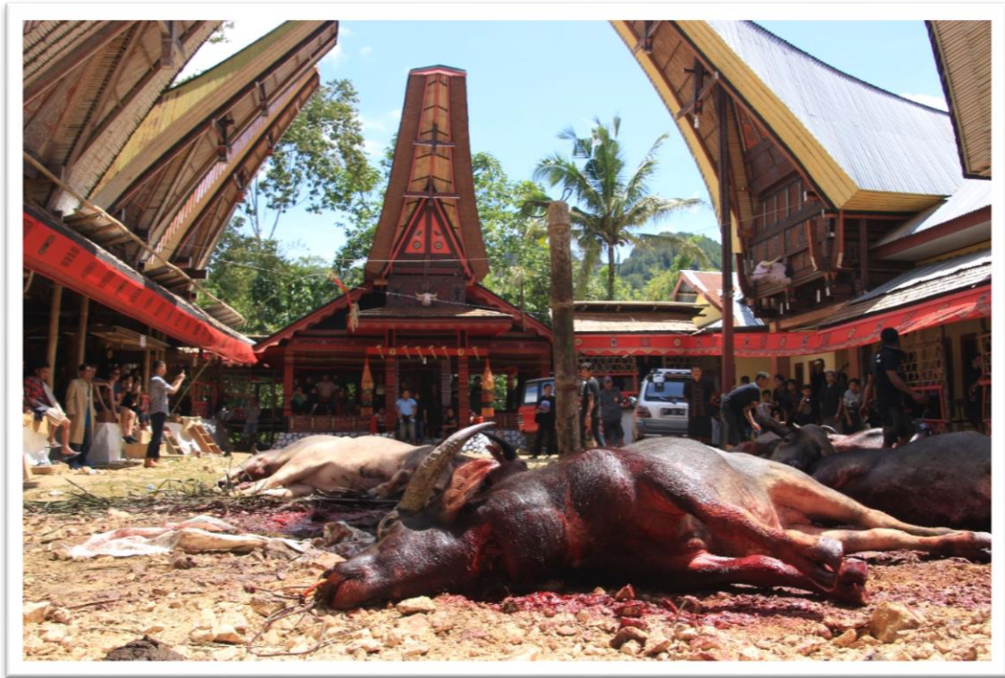
8. kép: A tomate főtere az áldozatmutatás befejeztével

20-30 perces kivézetés után 10-15 helyi egyből elkezdte ott a helyszínen feldolgozni a tetemeket. Megnyúzták őket, feldarabolták és az erre kijelölt két méter magas bambuszemelvényre tették a húst, ahonnan később szétosztásra került a családok között. A bölények bőrét sem hagyták kárba veszni, többször láttam, hogy a böllérek kihúzzák őket a kapun túlra, ahol beszákolják, és robogókra pakolják, hogy hazavihessék. A bölények fejét és szarvát a főtéren állították ki. A szarvakat kifőzték hiszen ezek a gyászoló család tróféáit fogják gazdagítani a későbbiekben: legtöbb esetben ezeket a szarvakat a tongkonánokra sorakoztatják fel, jelezve ezzel is gazdasági státuszukat.