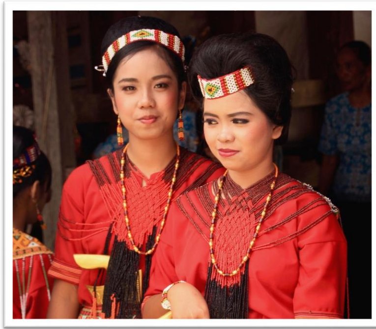
6. kép: Torajai lányok tradicionális öltözetben, ők az elhunyt unokái

Az állatáldozásokra csak a következő napokban került sor: ennek nem csak szakrális funkciója van, de gazdasági is, hiszen az állatok húsát szétosztják az ajándékhozók között, illetve egy adott mennyiséget még ott a helyszínen megsütnek, hogy ételt tudjanak felszolgálni a vendégeknek. A közösség az elhunytat, csak az első áldozati bivaly leölésétől tekinti valódi halottnak. Szakrális szempontból az állatáldozatra azért van szükség, mert a halott lelke a bivalyok lelkén vonul be a Puyaba , vagyis a túlvilágra. A hiedelmeiket leszámítva is erős szociális szerepet fedezhetünk fel a szertartásokban: ezek mérete mutatja meg a társadalom melyik csoportjához tartozik a halott, milyen gazdasági ereje van a klánnak.