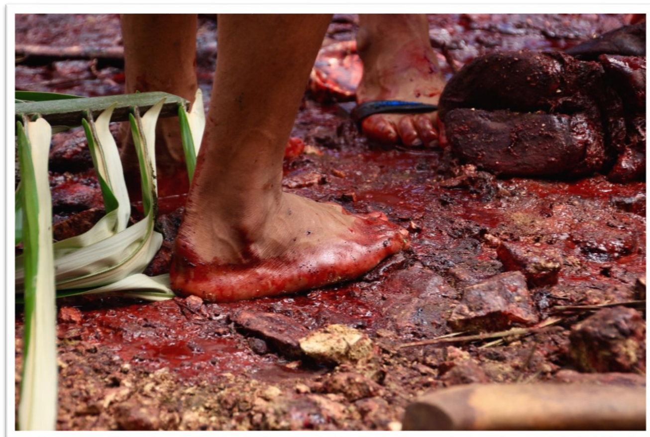
12. kép: Csendélet az állatáldozás után