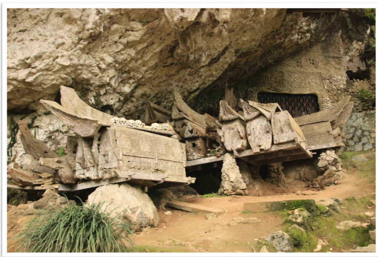
11. kép: Sziklasírok Kete Kesuban

A halotti szertartás utolsó szakasza ma'nene szertartás. Ebben a záró rítusban a halottat évente - ha van rá lehetőség a halála évfordulóján (ne felejtsük el, mint a fentiekben említettem a halott csak az első viziböleány feláldozása után számít halottnak) - exhumálják, a testet megmossák és megtisztítják, majd új ruhákba öltöztetik. Az esetlegesen sérült koporsót megjavítják vagy kicserélik majd beletéve a halottat, visszafektetik a sírba.