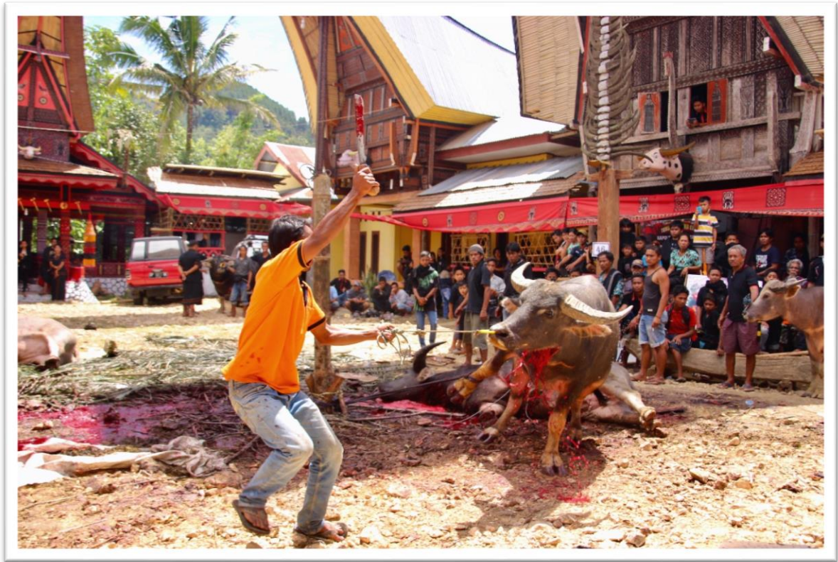
7. kép: A vizibölények feláldozása a képen látható módon történik

Amikor megérkeztünk az áldozási napra, már ki voltak jelölve a feláldozandó vizibölények, melyeket 14-20 év körüli fiatalok tartottak kötélben a pavilonok gyűrűjében. Aznap nagyjából 20-25 bölény nyakát vágta el egyesével, machettával. Ebben a pár órában az egész közösség szinte moziműsorként nézte az állatok feláldozását, és egy-egy szépen bevitt találatért, mikor szinte egyből összesett az állat, tapsoltak és kurjongattak. Az állatokat legtöbbször a gazdájuk, vagyis a felajánló fél ölte le, ami az állat felé mutatott tisztelet legfőbb jele. Guideunktól azt is megtudtuk, hogy a toraják körében ezek az állatok más presztízsből vannak számontartva, mint Ázsia más részein: a családfő szinte saját gyermekeként tekint rájuk, napi több órát és rengeteg energiát és pénzt fektet be a tartásukba, mindemellett talán a legfontosabb, hogy ezek a bölények sosincsnek befogva kemény munkára.