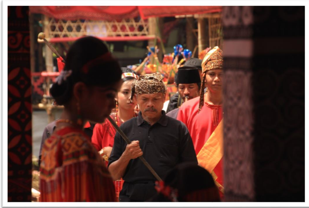
5. kép: A szertartás vezető a legközelebbi rokonokkal

Az ajándékok bemutatása és átadása után minden vendég helyet foglalt a számára kijelölt pavilonban, a közeli családoknak saját családnévre szóló helyük, külön épületük volt, míg a távolabbi hozzátartozók egy-egy bambuszemelvényen foglaltak helyet. Szerencsénknek köszönhetően minket a közvetlen hozzátartozók kínáltak helyel, így ajándékunk átadása után az egyik központi emelvényen kaptunk helyet, ahol mindenki óriási barátsággal fogadott minket, teával és kisebb falatokkal kínáltak. Mint később kiderült, egyetlen európai résztvevőként dicsőséget jelentett a családnak, hogy az idegeneket ők látták vendégül.