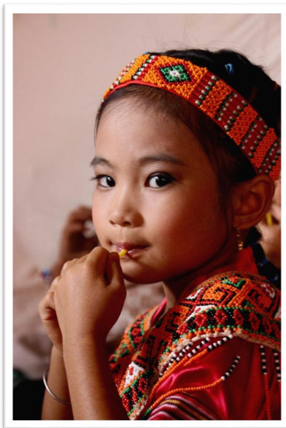
1. kép: Torajai kislány tradicionális öltözetben a temetésen

Európai mentalitással nehéz megérteni e nép kapcsolatát a halottakkal, mely elsősorban az irántuk mutatott tiszteletben fejeződik ki, de nem tartom túlzásnak kijelenteni, hogy a toraják életükben is a halálra készülnek. A temetési előkészületek sokszor igen hosszú hónapokig - akár évekig - tartanak. Ennek egyik oka, hogy a családtagok sokszor az ország más szigetein élnek, vagy még távolabb, így nehéz megszervezni a szertartásokat. Másik és erősebb indokként, úgy hiszem, gazdasági okokat fedezhetünk fel, ugyanis óriási anyagi terheket ró egy temetés a családra, s ennek köszönhetően előfordul, hogy évekig kell várni, amíg elegendő vagyont tud összegyűjteni a család.