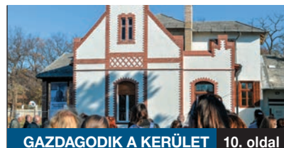
GAZDAGODIK A KERÜLET

A BRFK ÁLTAL RENDEZETT PROGRAMON a fiatalok három különböző helyszínen váltották egymást, és az egyórás beszélgetések során saját internetes tapasztalataikat is elmondhatták. Ma már szinte minden iskolás rendelkezik olyan okostelefonnal, amivel a nap minden percében rákapcsolódhat a világhálóra, és így bárki számára elérhető az online térben.