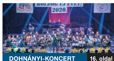
DOHNÁNYI-KONCERT 16. oldal