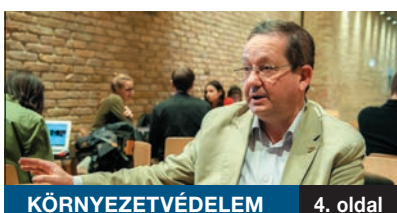
KÖRNYEZETVÉDELME 4. oldal

ILLÉS ZOLTÁN VOLT KÖRNYEZETVÉDELMI ÁLLAMTITKÁR szerint a XXI. század elején, a klímaváltozás, a hulladékkezelési problémák, a levegőtisztasági ügyek között a középén igenis kell hogy legyen egy olyan integratív államigazgatási egység, amit környezetvédelmi minisztériumnak neveznek.