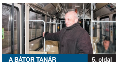
A BÁTORTANÁR 5. oldal

ILLÉS ZOLTÁN VOLT KÖRNYEZETVÉDELMI ÁLLAMTITKÁR szerint a XXI. század elején, a klímaváltozás, a hulladékkezelési problémák, a levegőtisztasági ügyek között a középén igenis kell hogy legyen egy olyan integratív államigazgatási egység, amit környezetvédelmi minisztériumnak neveznek.