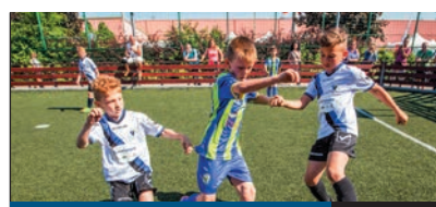
JÖN A SPORTÉLŐTŐ

A KÖZKEDVELT BÓKAY-KERTI NAPOKAT idén szeptember 6–7-én rendezik a népszerű parkban. Aki kilátogat a „Nagyi főzje” fesztiválra, az azért jár jól, mert ezúttal is érdekesnek ígérkezik a menüválaszték, aki pedig a színpadi események kedvéért megy, az azért, mert szokás szerint bőséges kínálatból válogathat a kétnapos programsorozat folyamán.