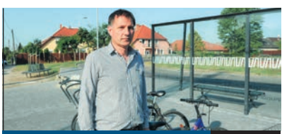
MEGÚJUL A VÉGÁLLOMÁS

A GYÖNGYVIRÁG, a Napsugár és a Csemete óvodában indult augusztus második felében az önkormányzat idej játszóeszköz-fejlesztési programja. Ezeket kívül további 17 óvodában készülnek el ezekben a hetekben az új játszóeszközök minőségi kivételben, amelyek a remények szerint a mozgáskultúra fejlesztésével a sportolás iránti vágyat is kialakítják a gyerekekben.