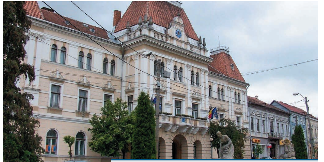
Az országzászló 1941-es avatása Székelyudvarhely főterén

A két település önkormányzataiban dolgozók tudják, hogy egy testvérvárosi kapcsolat akkor eredményes és életképes, ha a polgárok abban a lehető legaktívabban vesznek részt. Ezért törekednek majd arra, hogy Székelyudvarhely és a XVIII. kerület együttműködése ne