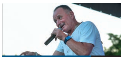
ITT A NAGYI FŐZTJE

NEMSOKÁRA EGY EGÉSZÉBEN MEGÚJULT autóbusz-végállomás fogadja a pestszentimrei utasokat a Benjámin utcai buszfordulóban. A fontos közlekedési pont elhanyagolt volt, és rendkívül kellemetlen volt a világítás nélküli környéken közlekedni. Sok gondot okozott a felgyülemlett csapadékvíz is. Mindez most megoldódik az önkormányzat beruházásának köszönhetően.