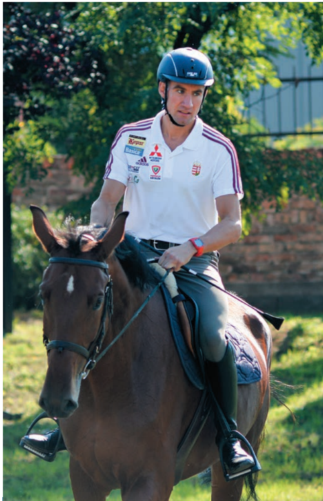
Marosi Ádám (Budapest, 1984. július 26.) Sportága: öttusa Egyesülete: Budapest Honvéd Legjobb eredményei: olimpiai bronzérem (London, 2012), egyéni és csapatvilágbajnok (London, 2009), Eb egyéni és csapat-ezüst (Székesfehérvár, 2018)