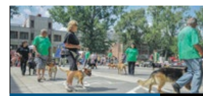
ÜNNEP A HAVANNÁN

A NYÁRI SZÜNIDŐIG már csupán néhány hét van hátra, így a hagyományainkhoz híven egy öszeállításal igyekszünk segíteni a családoknak a megfelelő program kiválasztásában. Az önkormányzat által szervezett, változatos szórakozást kínáló nyári tábor mellett a Városgazda Utánpótlás Akadémia és a kerületi művelődési házak, szervezetek ajánlatait gyűjtöttük össze.