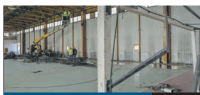
MULTIFUNKCIÓS 3. oldal

GYEREKZSIVAJ – ez a neve annak a rendkívüli játszótér-felújítási programnak, amelynek során, a szokott éves játszótér-felújítás és -karbantartás mellett, hét kerületi játszótér alakul át teljesen. Arról, hogy milyenek legyenek ezek a közösségi terek, Ughy Attila polgármester kezdeményezésére maguk a lakosok dönthettek egy kérdőív kitöltésével.