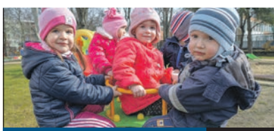
SZÉPÜLŐ JÁTSZÓTEREK 2. oldal

GYEREKZSIVAJ – ez a neve annak a rendkívüli játszótér-felújítási programnak, amelynek során, a szokott éves játszótér-felújítás és -karbantartás mellett, hét kerületi játszótér alakul át teljesen. Arról, hogy milyenek legyenek ezek a közösségi terek, Ughy Attila polgármester kezdeményezésére maguk a lakosok dönthettek egy kérdőív kitöltésével.