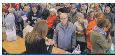
HÚSVÉTI ÉLELMISZER 4. oldal

MEGKEZDŐDÖTT az idei esztendő legnagyobb kerületi beruházásának előkészítése, a Lőrinci Sportcsarnok – új nevén BUD Aréna – átépítése. A várhatóan mástól év múlva elkészülő létesítmény kétoldali lelátóval ezer fő befogadására alkalmas multifunkcionális sportcsarnok lesz, ahol a sportolás mellett kulturális eseményeket, konferenciákat is rendezhetnek.