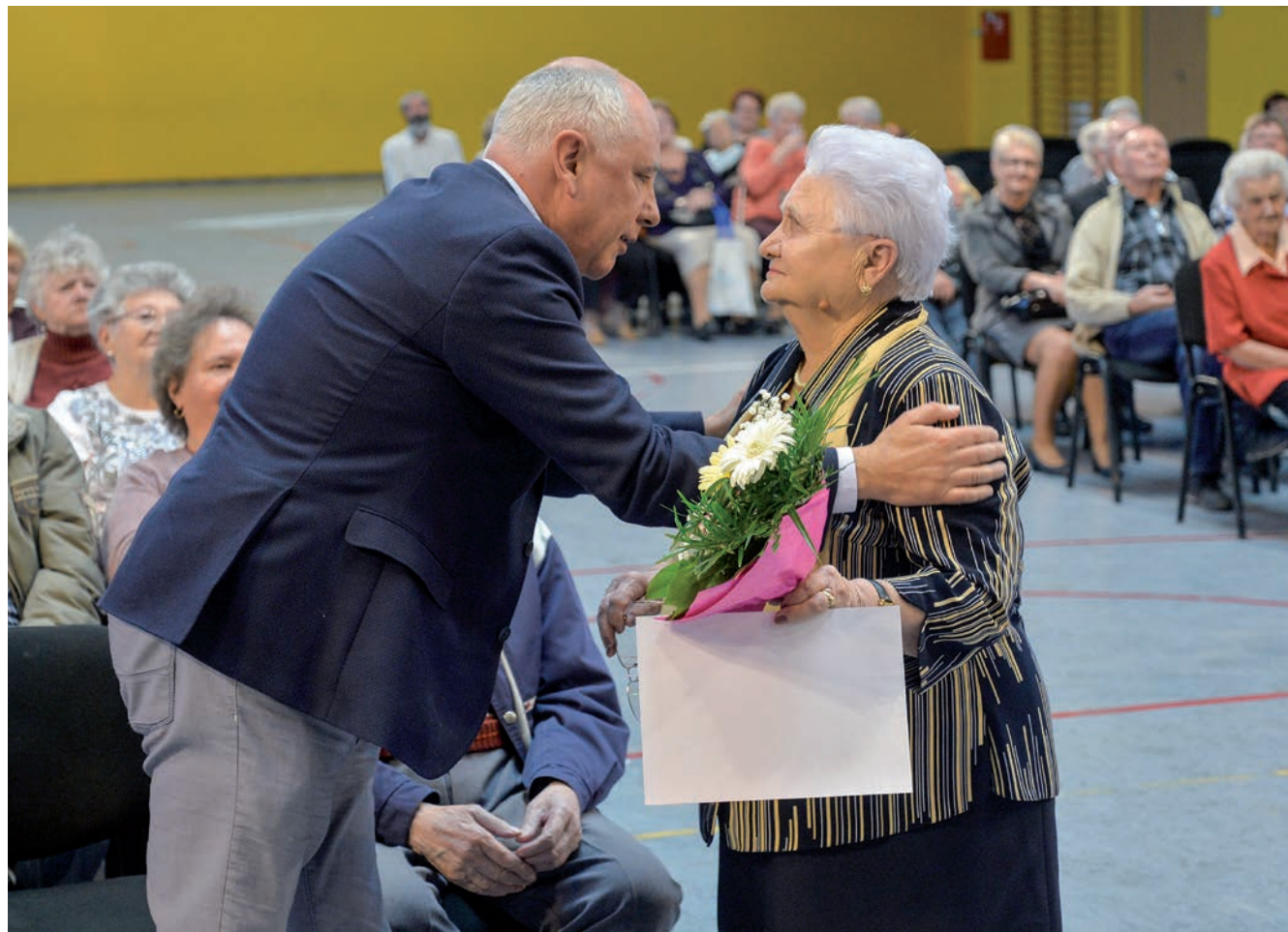
Ughy Attila polgármester az idősek megbecsülését a társadalom fokmérőjének tekinti

Egy biztos, az idősokorúakat évente legalább egyszer „hivatalosan” ünnepeljük, méghozzá az október 1-jei idősek világnapján. A kerületünkben szeptember utolsó vasárnapján a Pestszentimrei Sportkastélyban gyűltek össze a nyugdíjasok, hogy a számukra szervezett jó hangulatú délután részesei lehessenek.