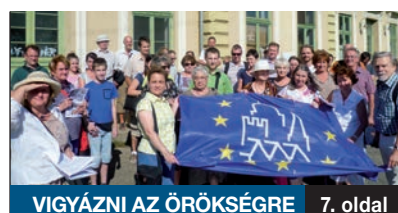
VIGYÁZNI AZ ÖRÖKSÉGRE

A FŐVÁROSI ÉS A PEST MEGYEI egészségügyi intézményhálózat több mint 4 millió embert lát el. Az Egészséges Budapest Program révén 3 centrumkórházat hoznak létre, s további 25 társorkházban és 32 szakrendelőben valósítanak meg különböző korszerűsítéseket, amelyek keretében a XVIII. kerületi önkormányzat több mint 300 millió forintot fordíthat fejlesztésekre.