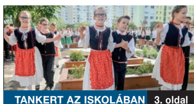
TANKERT AZ ISKOLÁBAN

A 2015 ÓTA ZAJLÓ járda felújítási program több okból is szükséges. Egyrészt a járdák kopnak, romlanak az időjárás és a használat miatt, de a folyamatos karbantartással el lehet érni, hogy biztonságosak legyenek. Másrészt a kerületben is megvalósított nagyszabású fővárosi csatornázási projekt után helyre kell állítani az érintett szakaszokat.