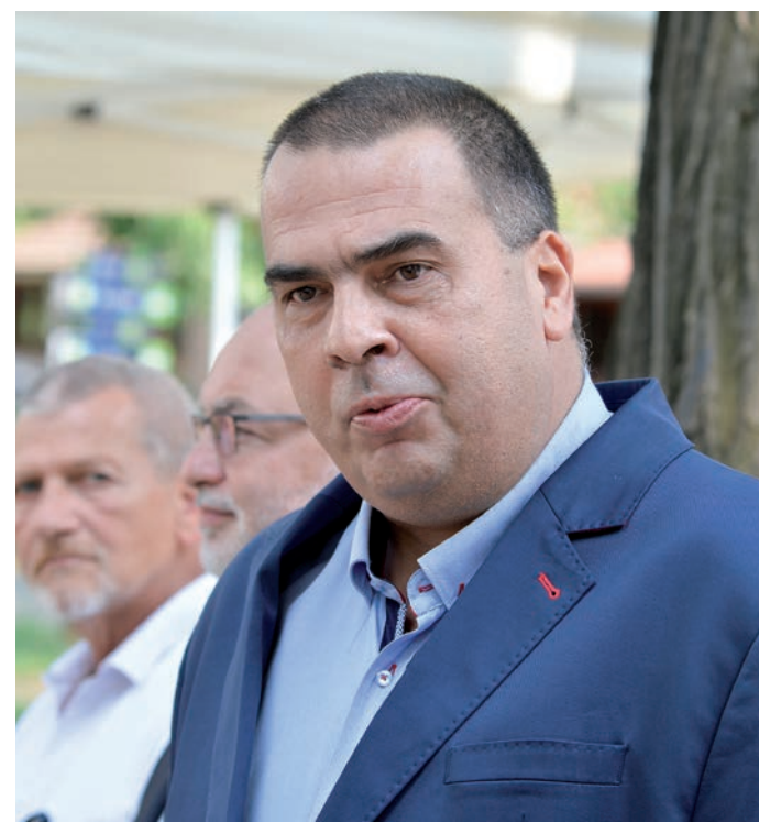
Az új kerületi rendőrkapitány, Jánosik István ezredes