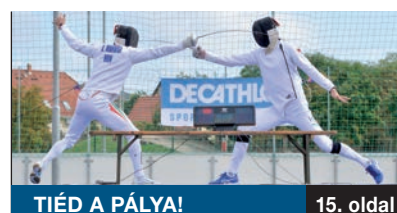
TIÉD A PÁLYA!

A KULTURÁLIS ÖRÖKSÉG NAPJAI elnevezésű országos programsorozat kerületi szervezői változatos programokkal járultak hozzá a helyi rendezvények sikeréhez. Szeptember 15–16-án sétálhattunk ipari emlékek között, egy izgalmas bunkerben, és megismerkedhettünk a Lőrincen felcsiperedő Szécsi Margit költőnő igazán mély gondolataival és életével.