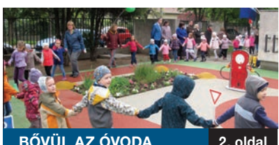
BŐVÜL AZ ÓVODA