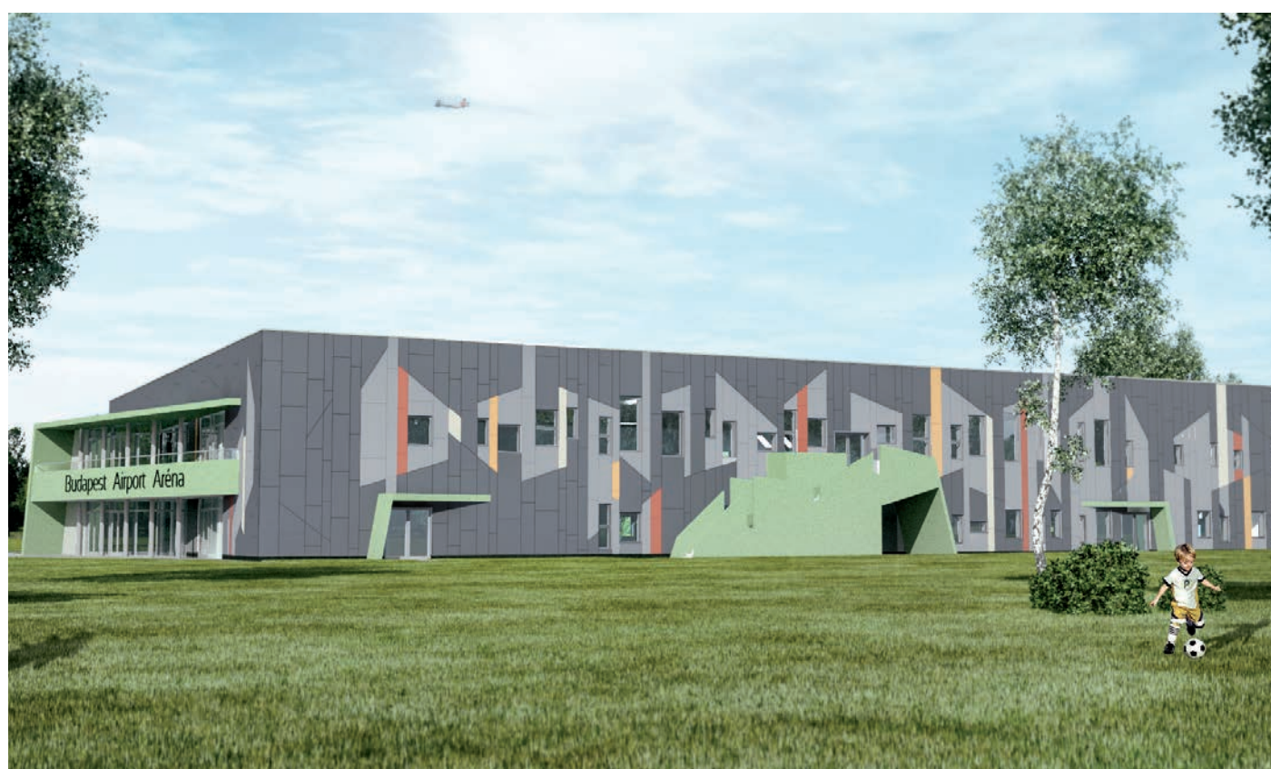
A Deák Ferenc „Bamba” Sportcsarnok fejlesztését a kézilabda-szövetség és a HungaroControl is támogatja

A lőrinci csarnok felújítása egy bonyolult pénzügyi konstrukci-