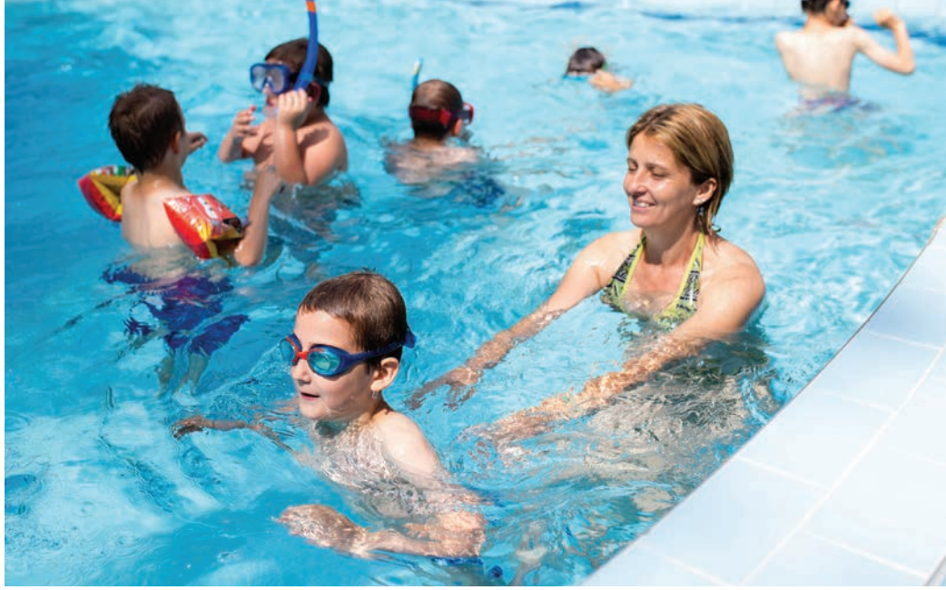
AZ OLDALT ÖSSZEÁLLÍTOTTA: RÓTH FERENC

Ünnepélyes évzárót, de inkább önfelédlt bulit tartott a Városgazda Utánpótlás Akadémia június 8-án a Bókay-kerti strandon, száz meg száz felszabadult és tehetséges gyermek részvételével. A cél az volt, hogy a szakosztályok, a sportolók és a vezetők elbúcsúzzanak az akadémia életében immár harmadik „tanévtől”, s egyúttal ünnepélyesen megnyissák a strandot és köszöntsék a nyarat.