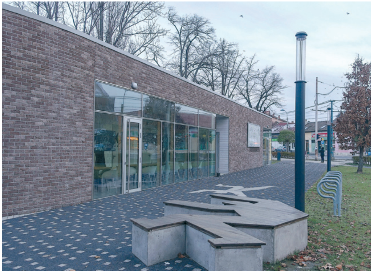
A Kossuth tér megújítása az önkormányzat egyik fontos fejlesztése

A Kossuth tér megújítása az önkormányzat egyik látványos projektje. A