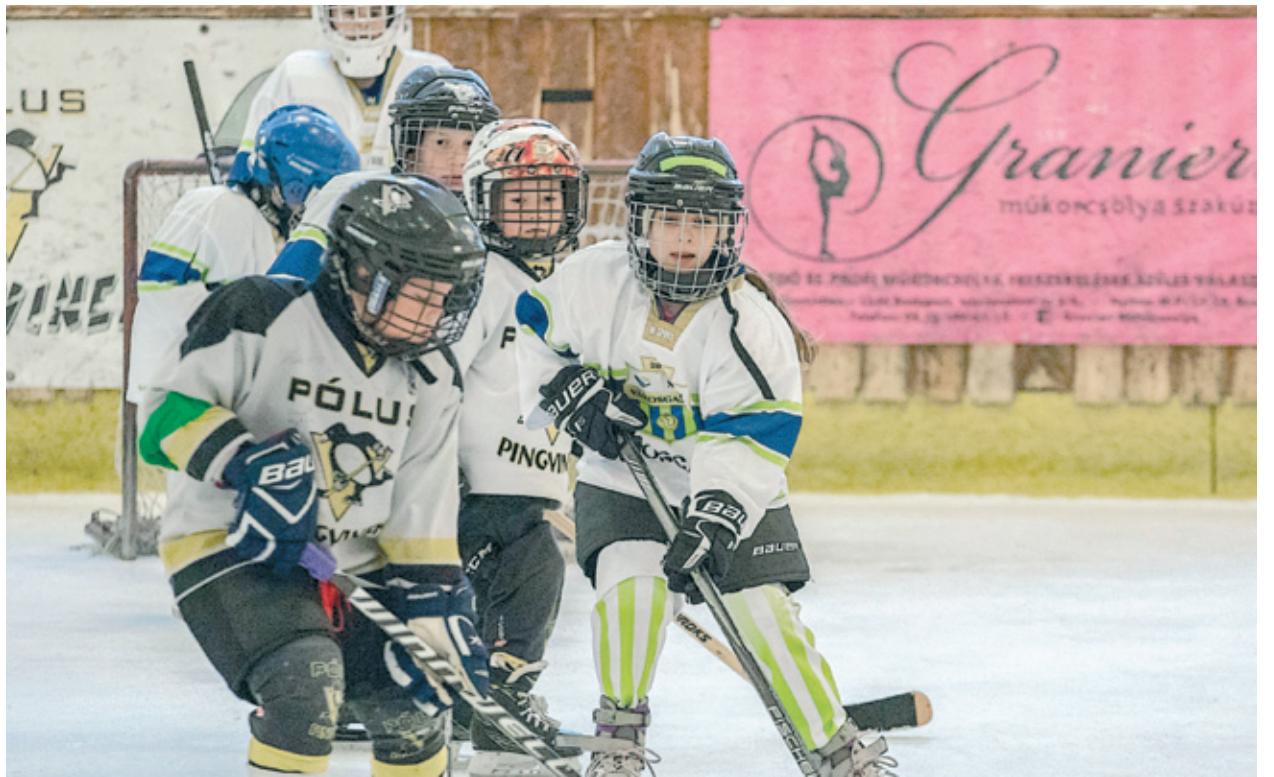
Az új szakosztály apró tehetségei a Pólus Centerben mutatkoztak be

A részt vevő csapatok tagjait, bár „gladiátorsportot” űznek, csak tündéri gyerekeknek nevezhette mindenki, hiszen olyan aranyosak voltak a marcona hokis öltözetben, a hatalmas korikkal