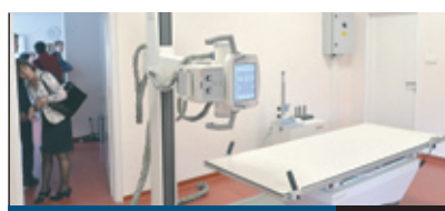
ELSŐ AZ EGÉSZSÉG