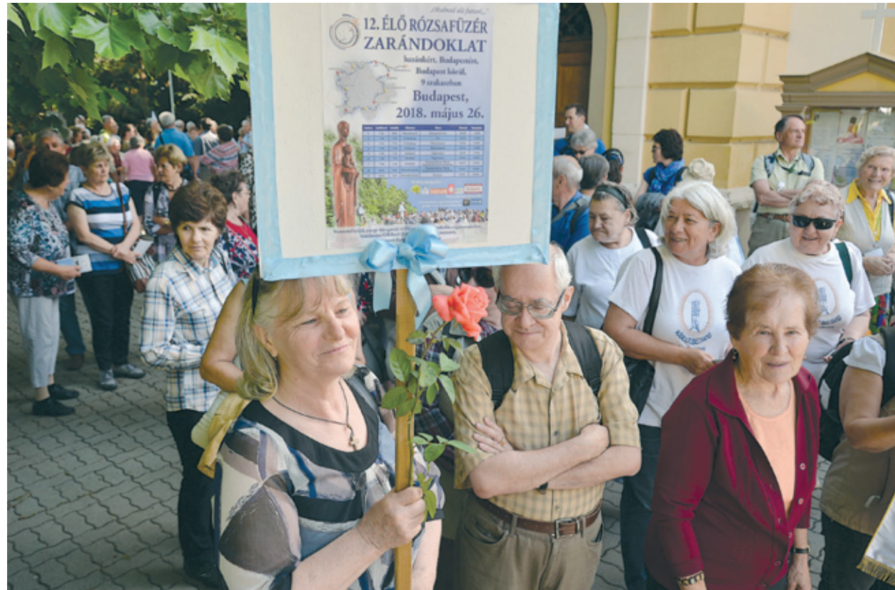
A soroksári főplébániától a pestszentimrei templomig 12,5 kilométert teljesítettek a zárándokok

Karitás önkéntesei készítettek nekik – mint már évek óta.