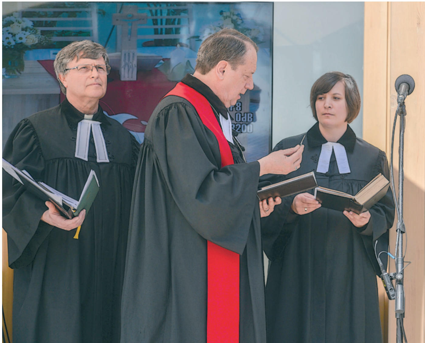
Az új kápolnát Gáncs Péter püspök szentelte fel

Az ünnepséget megelőzően az Új Teremtés együttes gondoskodott a meghitt hangulatról, egyházi énekekkel köszöntve és szórakoztatva az érkező vendégeket, akiket a bejáratnál baráti szóval és apró falatokkal fogad-