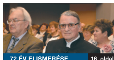
72 ÉV ELISMERÉSE

ÜNNEPÉLYES KERETEK között, zárókö-elhelyezéssel és istentisztelettel szentelték fel április 14-én a pestszentimrei evangélikus hívek új lelki hajlékát, a kastélydombi Luther-kápolnát, amely egy esztendő alatt épült fel a Nemes utca 62. alatt található épület kertjében. A helyi evangélikusok régi álma vált valóra azzal, hogy egy új otthont kaptak.