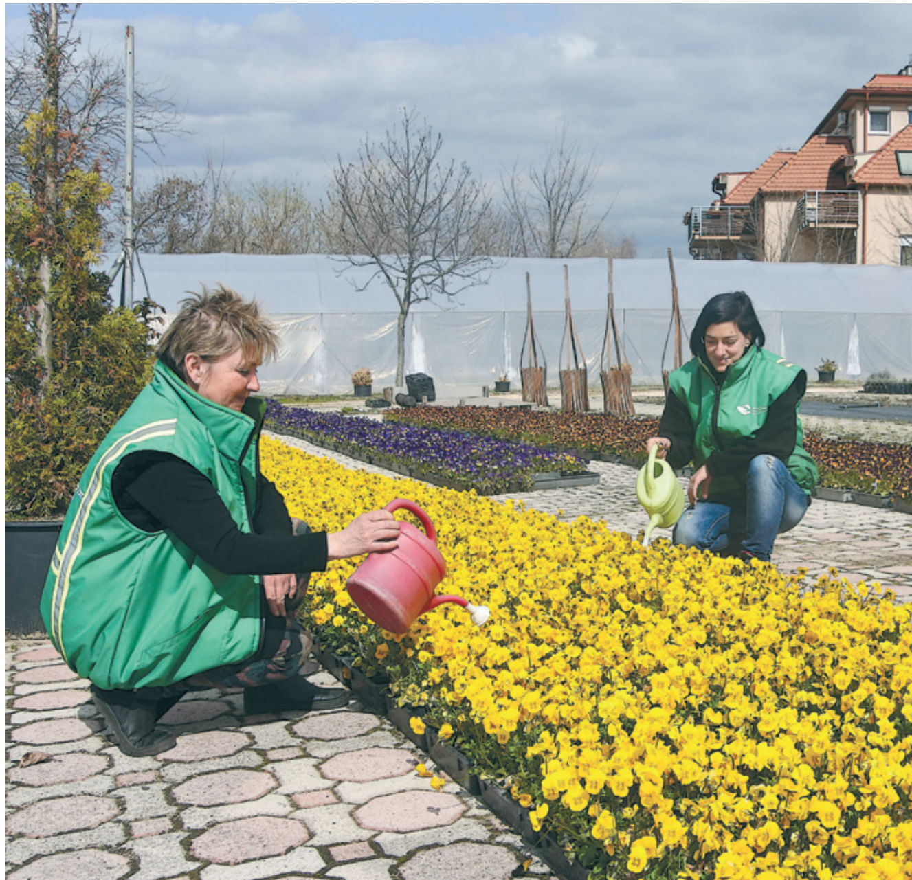
A Városgazda Zrt. munkatársai kilencven ezer palántát neveltek az idei szezonra

A tavasz beköszöntével évről évre virághatárak öltönek a kerület közterei és az intézmények udvarai. A Városgazda XVIII. kerület Nonprofit Zrt. dísnövény-termesztési programja keretében a cég Haladás utcai kertészeti telephelyén nevelt virágokat ültetik ki a virágágyásokba.