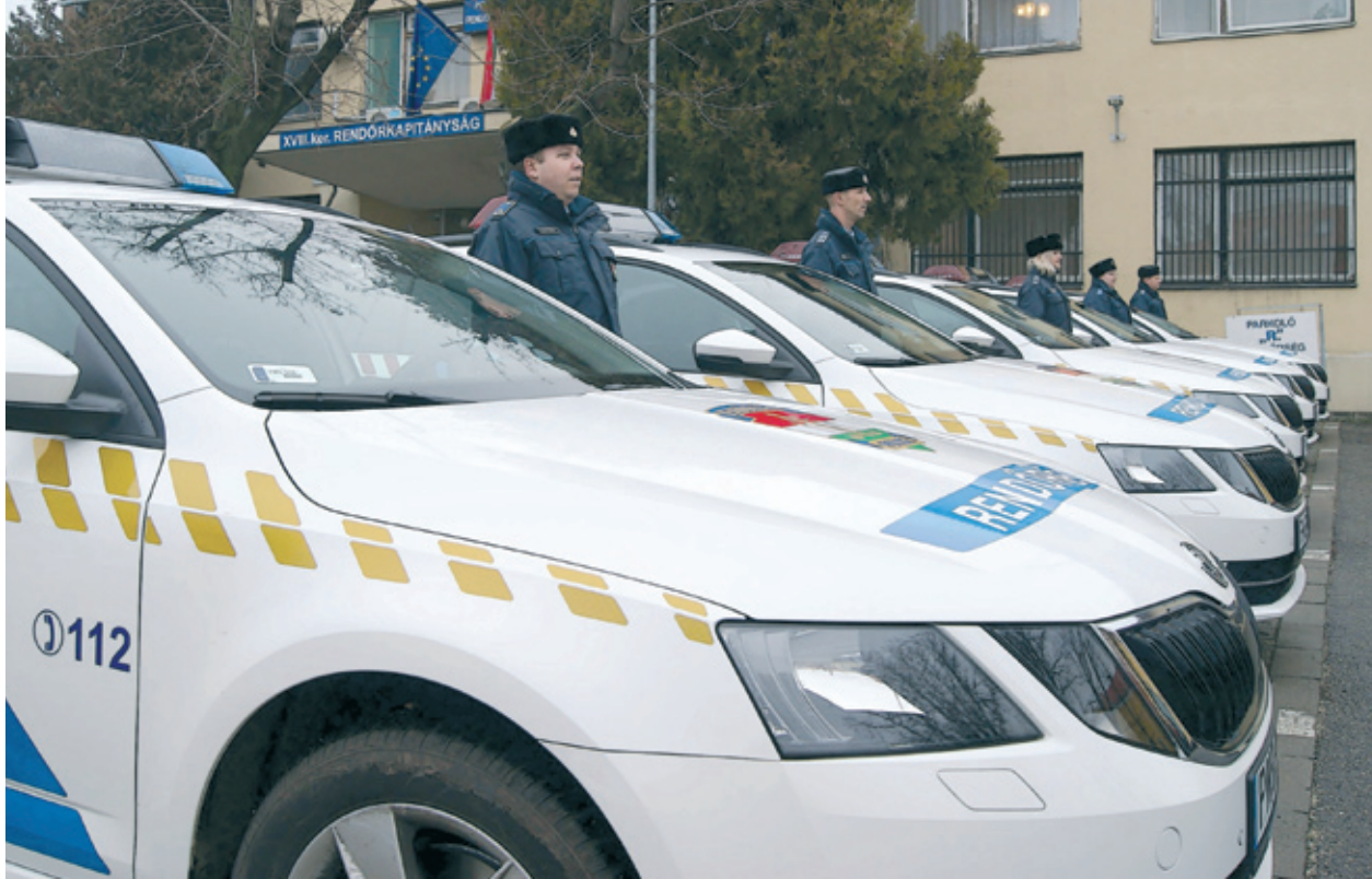
Öt új szolgálati gépkocsit kapott a kerületi rendőrség