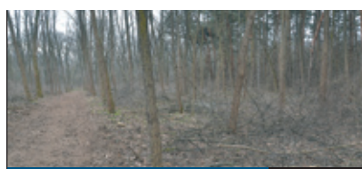
ÓVJÁK AZ ERDŐT

SZIGORÓDNÁK a középületekkel szembeni energetikai elvárások az Európai Unióban, ezért a XVIII. kerületi önkormányzat folyamatosan keresi a módját annak, hogyan működtetheti a saját tulajdonában lévő épületeket takarékosan, az előírásoknak megfelelően. Egy új lehetőség az eCentral projekt, amelynek keretében a pestszentimrei Vackor óvoda újulhat meg.