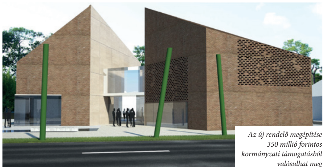
Az új rendelő megépítése 350 millió forintos kormányzati támogatásból valósulhat meg

a betegek. A főváros fekvőbeteg-ellátó intézményhálózata azonban jelentős lemaradásban van. 2017-ben Budapest legnagyobb kórházfejlesztési programja indult el, és a következő nyolc-tíz évben várhatóan mintegy 700 milliárdos fejlesztést hajtanak végre a fővárost és az agglomerációt kiszolgáló egészségügyi intézményekben. Budapesten három centrumkórház jön létre, az Egészséges Budapest Program keretében pedig 42,5 milliárd forintból 16 szakrendelő újulhat meg a központi régióban. A fejlesztések magukban foglalják az infrastruktúra és az esz-közállomány korszerűsítését is.