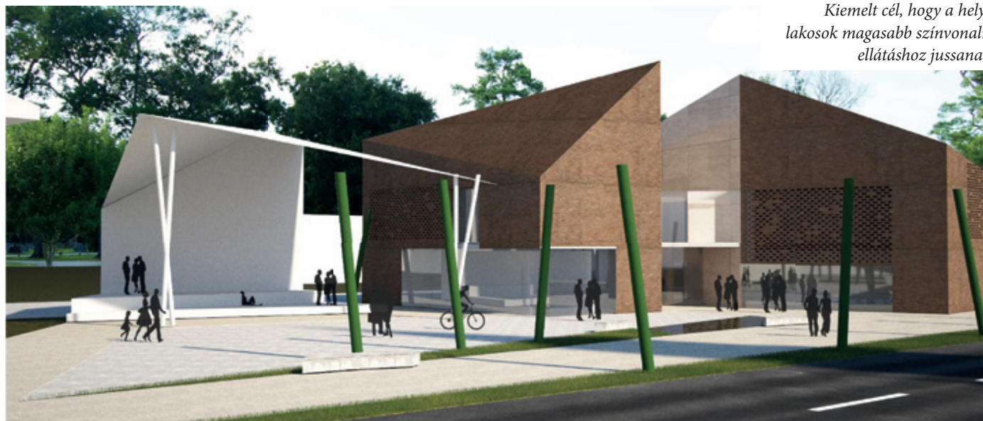
Kiemelt cél, hogy a helyi lakosok magasabb színvonalú ellátáshoz jussanak

Mint azt már korábban megírtuk, kormányzati támogatással új gyermekorvosi és fogorvosi rendelő épül Pestszentimrén a Címer, az Ady Endre és a Nemes utca által határolt terület közel húszéves rendelőintézeté mellé. A beruházás előkészületei már folynak, nemrégiben a látványtervek is megszülettek.