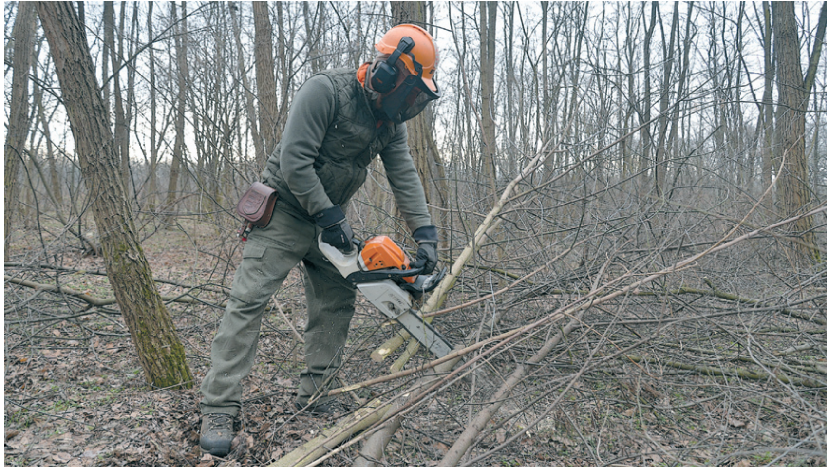
A szakember megerősítette, hogy miután minden kitermelt fa helyén új fát nevelnek, hosszú távon az erdőtömb levegőtisztító hatása nem változik

téket nevelni – mutatott rá az erdőszet vezetője.