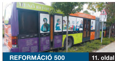
REFORMÁCIÓ 500 11. oldal

REPÜLTŐTEREN KONCERTEZNI? Nem lehetetlen. Október 22-én az 1-es terminál utascsarnokában adtak hangversenyt a CAFe Budapest fesztivál keretében a debreceni Kodály Filharmonikusok, a Kodály Kórus, a Talamba Utóegyüttes és a Vörösmarty Gyermekkar. A koncert ötlete onnan jött, hogy két évvel ezelőtt itt tartották a kerületi önkormányzat karácsonyi ünnepségét.