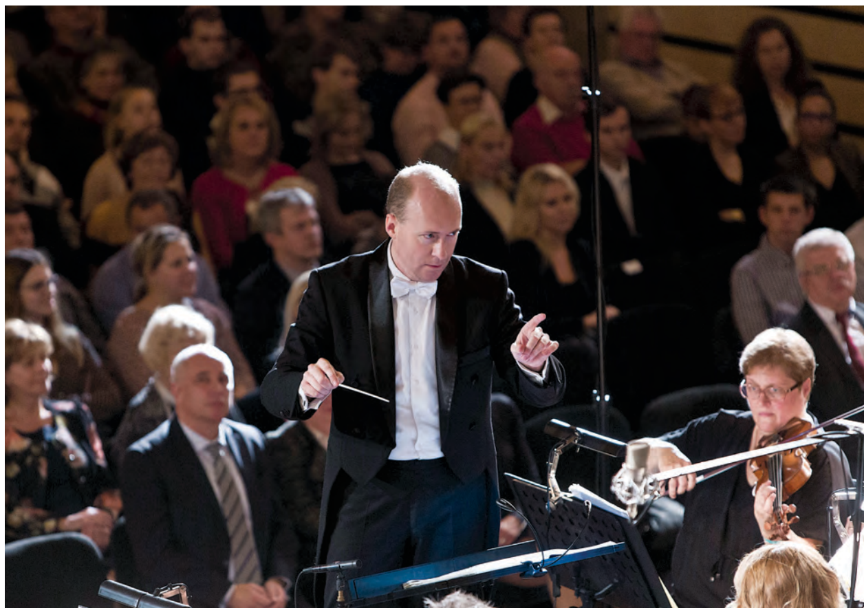
A repülés és a zene tudatos összekapcsolásaként a képzeletbeli repülőgép „törzsében” szervezték meg a hangversenyt