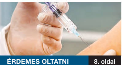
ÉRDEMES OLTATNI 8. oldal